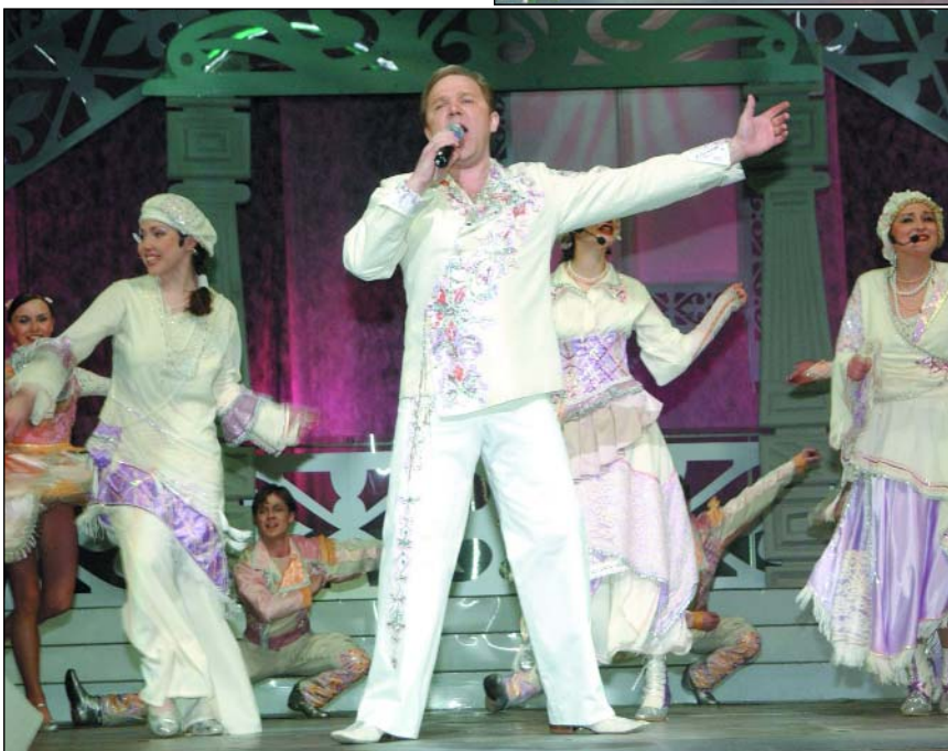
Новый проект – фолк-группа «ЯР-марка»

этой музыкой, а зал ее не очень тепло воспринимает, и тогда она говорит: да, ты был прав. Значит, она стала больше прислушиваться. Я не строгий, я пытаюсь быть мудрым и направлять ее в нужную сторону, не торопясь, не спеша.