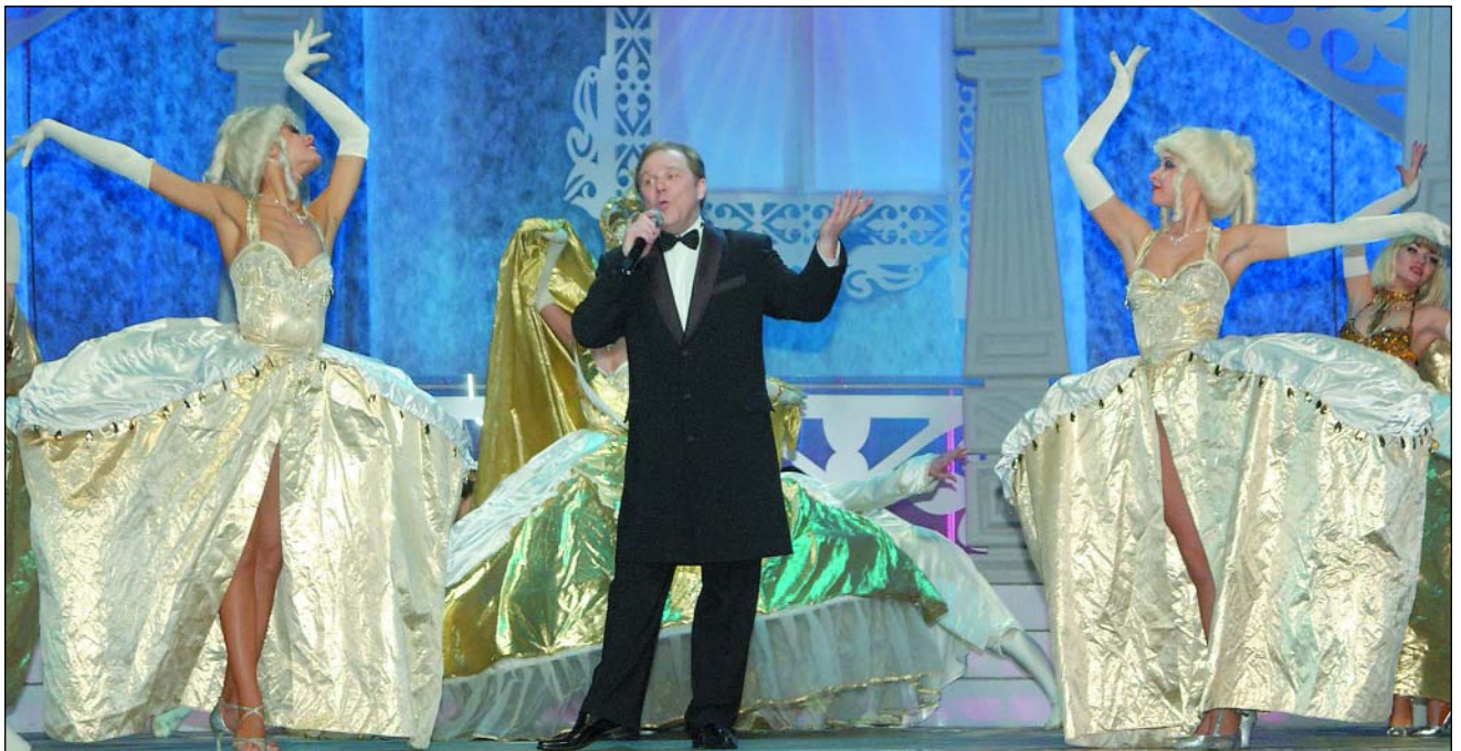
Тембр его голоса глубок и благороден

– Нет, не кажется, и объясню почему. Дело в том, что мы живем в XXI веке и, образно выражаясь, уши современных людей уже не те, что были, скажем, в начале прошлого или тем более позапрошлого веков. А ведь если рассмотреть технологию инструментального сопровождения народной песни, то конец XVI века – это сначала гусли, потом рожки, жилейки духовые. Балалайки еще не было, баяна тоже, и так продолжалось до середины XIX века. И только с появлением этих инструментов русская народная песня зазвучала под балалайку и баян. Последний быстро вошел в широкий