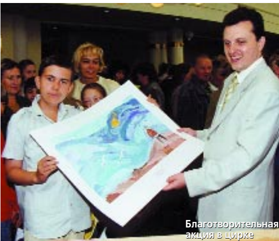
Благотворительная акция в цирке

российские и европейские компании, с которыми мы сотрудничаем. С их помощью были подготовлены 80 призов, которые и разыгрывались в благотворительной лотерее. Участвовали в ней инвалиды-чернобыльцы и владельцы дисконтных карт магазинов «Мир ванн», входящих в объединение «Плакард». Главный приз (чему мы очень рады) – гидромассажную ванну – выиграл инвалид-чернобылец.