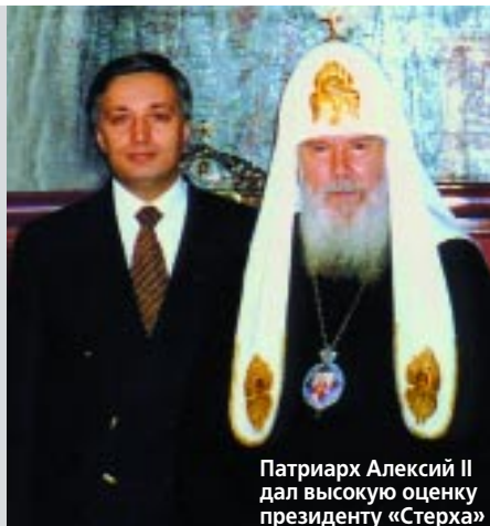
Патриарх Алексий II дал высокую оценку президенту «Стерха»

Вот уже два года подряд корпорация «Стерх» перечисляет денежные