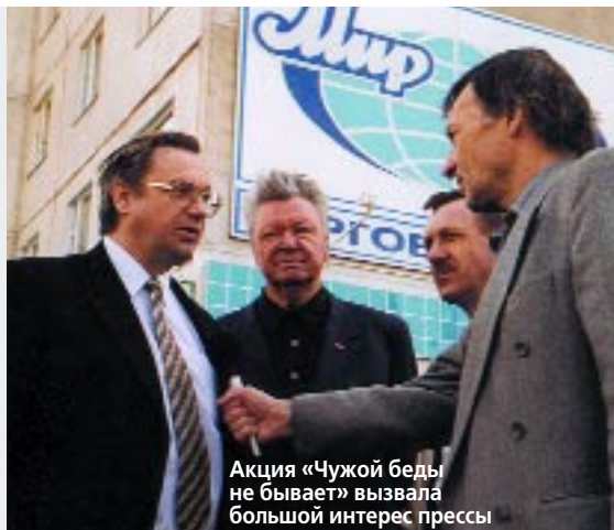
Акция «Чужой беды не бывает» вызвала большой интерес прессы