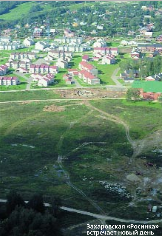
Захаровская «Росинка» встречает новый день

миссии, годами привыкшей к одним и тем же опытным неудачникам-абитуриентам, мягко говоря, подивившись нахальству юноши, посоветовали набраться опыта где-нибудь в сфере, близкой кинопроизводству. Например, на ТУ.