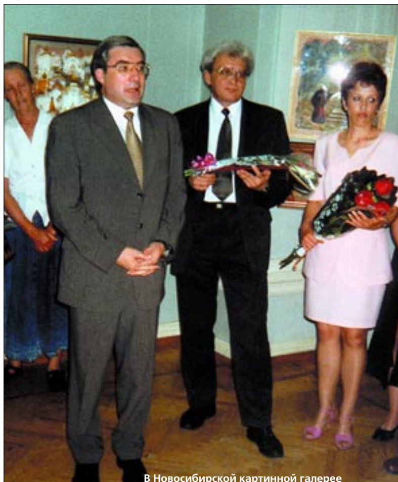
В Новосибирской картинной галерее

Областная администрация сегодня по-новому работает с мэрией Новосибирска. В отличие от прежних лет, мы все важ-