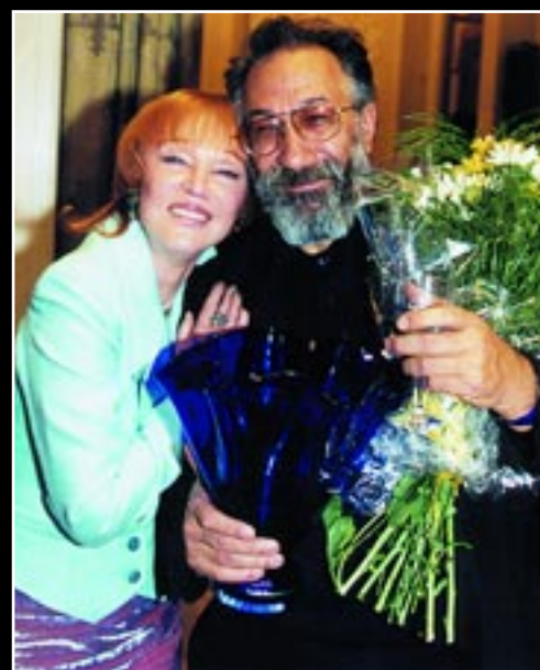
Л. Гурченко и А. Чилингаров на открытии клубного сезона. Дом Дружбы, октябрь 1999 г.

«Быть членом Английского клуба – означает преуспевать», как будто на века авторитетно определил знаменитый русский словарь Брокгауза и Ефрона. Впрочем, сегодня, как и два века назад членами Английского клуба становятся лишь самые достойные.