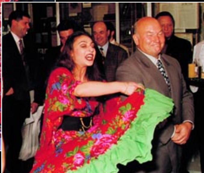
Почетный старшина клуба Ю. Лужков на открытии выставки, посвященной 227-летию Московского Английского клуба

судить по его завсегдатаям: насмешливый Пушкин, остролов Крылов, великий правдоискатель Лев Толстой, саркастичный до язвительности Грибоедов, Чаадаев, Жуковский и многие-многие другие. В те годы по свидетельству историка и писателя Николая Карамзина считалось, что «надобно ехать в Английский клуб, чтобы узнать общее мнение».