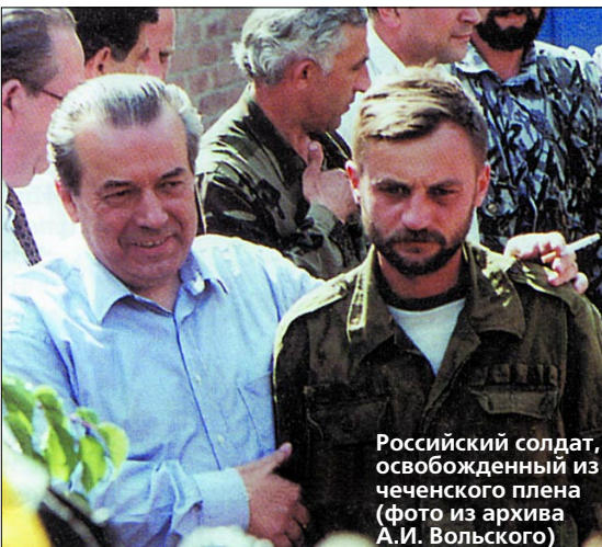
Российский солдат, освобожденный из чеченского плена

– 11 съезд РСПП, действительно, представляет определенную веху в нашей жизни. Мы были должны, просто обязаны констатировать тот факт, что за последнее время резко изменился состав промышленников в сфере реального