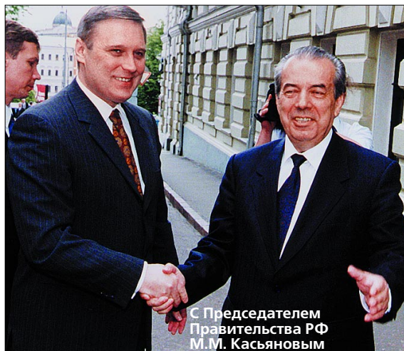
С Председателем Правительства РФ М.М. Касьяновым

– Союз, который Вы возглавляете, всегда стремился защитить интересы людей производства, руководителей