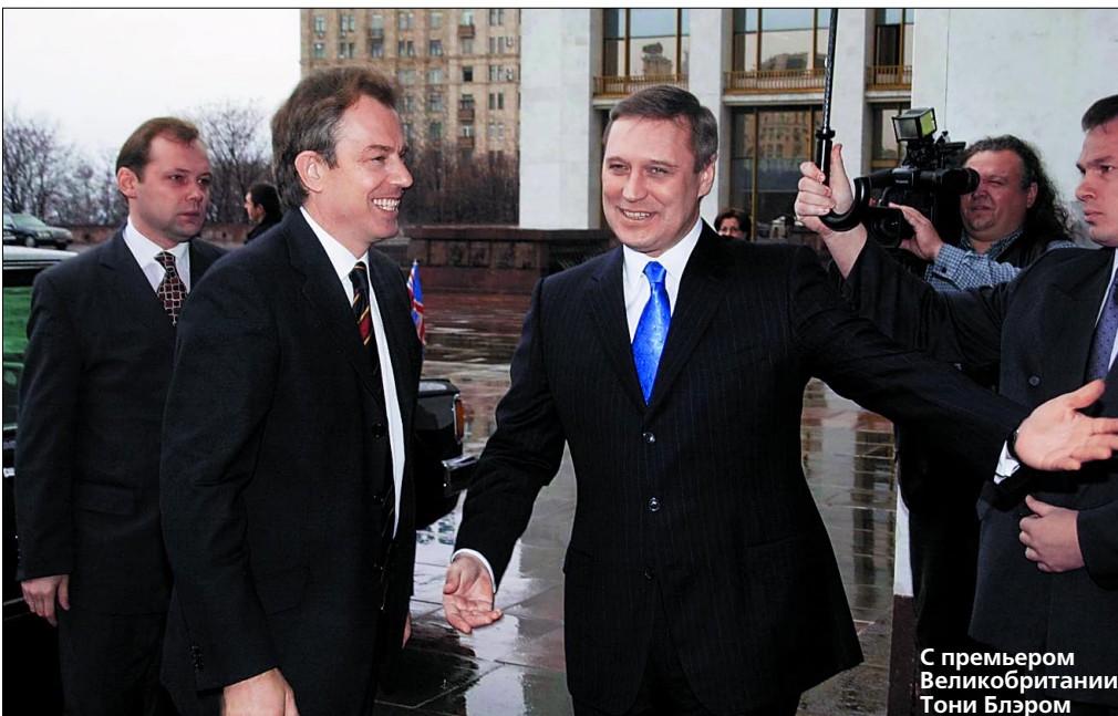
С премьером Великобритании Тони Блэром

общественными деятелями есть немало известных представителей крупного и среднего бизнеса. Меня как руководителя этих общественных организаций чрезвычайно волнует вопрос: возможно ли в нашей стране проведение реформ без усиления основ демократии, намерено ли Правительство продолжать диалог с обществом и, прежде всего, с так называемыми флагманами отечественной экономики и бизнеса? И как Вы, имеющий богатый личный опыт переговоров с зарубежными финансовыми институтами, оцениваете перспективы поступления зарубежных инвестиций в нашу экономику?