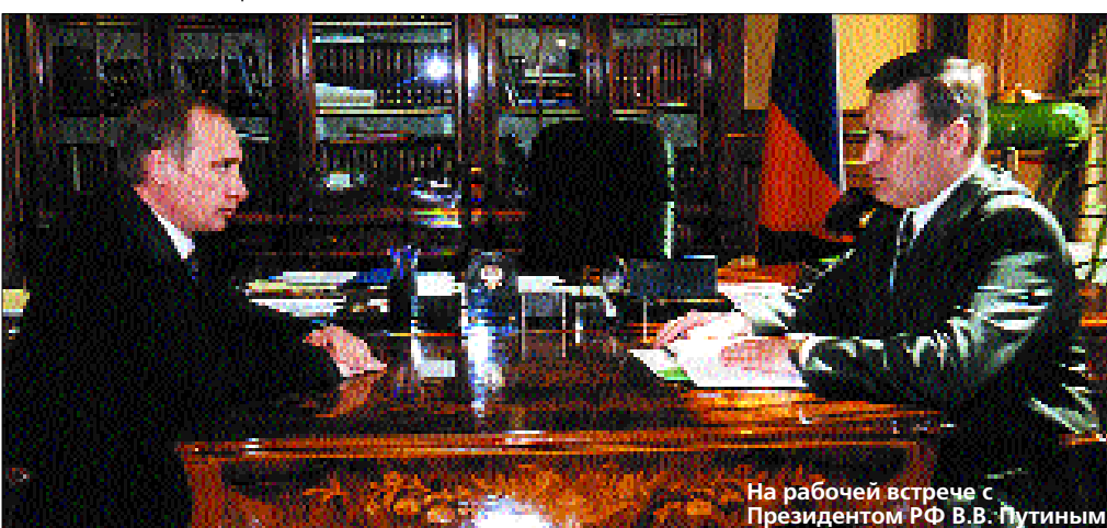
На рабочей встрече с Президентом РФ В.В. Путиным

Среди их членов, наряду с выдающимися деятелями науки и культуры, видными государственными и