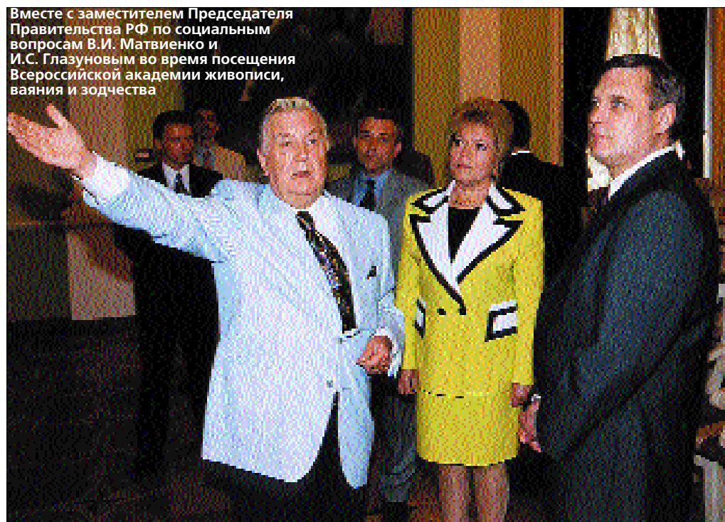
Вместе с заместителем Председателя Правительства РФ по социальным вопросам В.И. Матвиенко и И.С. Глазуновым во время посещения Всероссийской академии живописи, ваяния и зодчества

Сегодня Россия имеет дешевый тариф и этим отечественный бизнес должен воспользоваться, но не для того, чтобы пребывать в тепличных условиях, не модернизировать свое производство, не экономить энергию, не вводить новые технологии, живя только на дешевом сырье и на дешевой электроэнергии, а для инвестирования в развитие собственного производства.