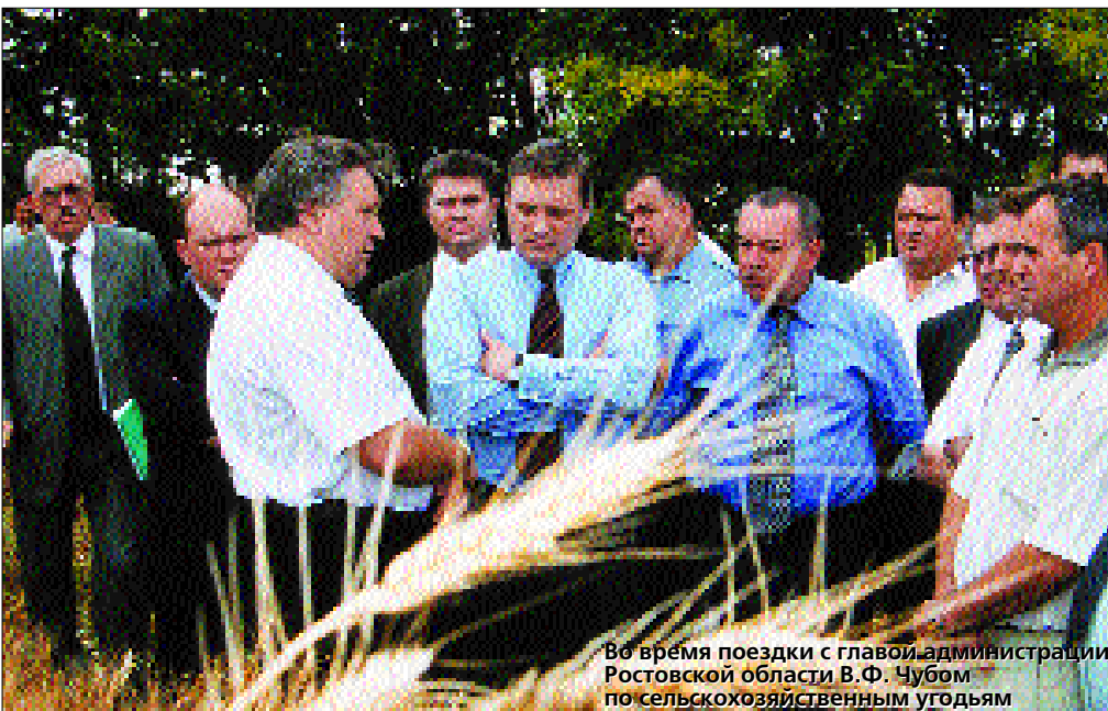
Во время поездки с главой администрации Ростовской области В.Ф. Чубом по сельскохозяйственным угодьям

на уровне 9–9,5 процентов, в некоторых отраслях – 20, где-то 25 процентов. Общий же рост в промышленности составит – это мой прогноз – примерно 9–9,5 процентов. А в сельском хозяйстве в этом году рост объемов производства будет приближаться к 5 процентам.