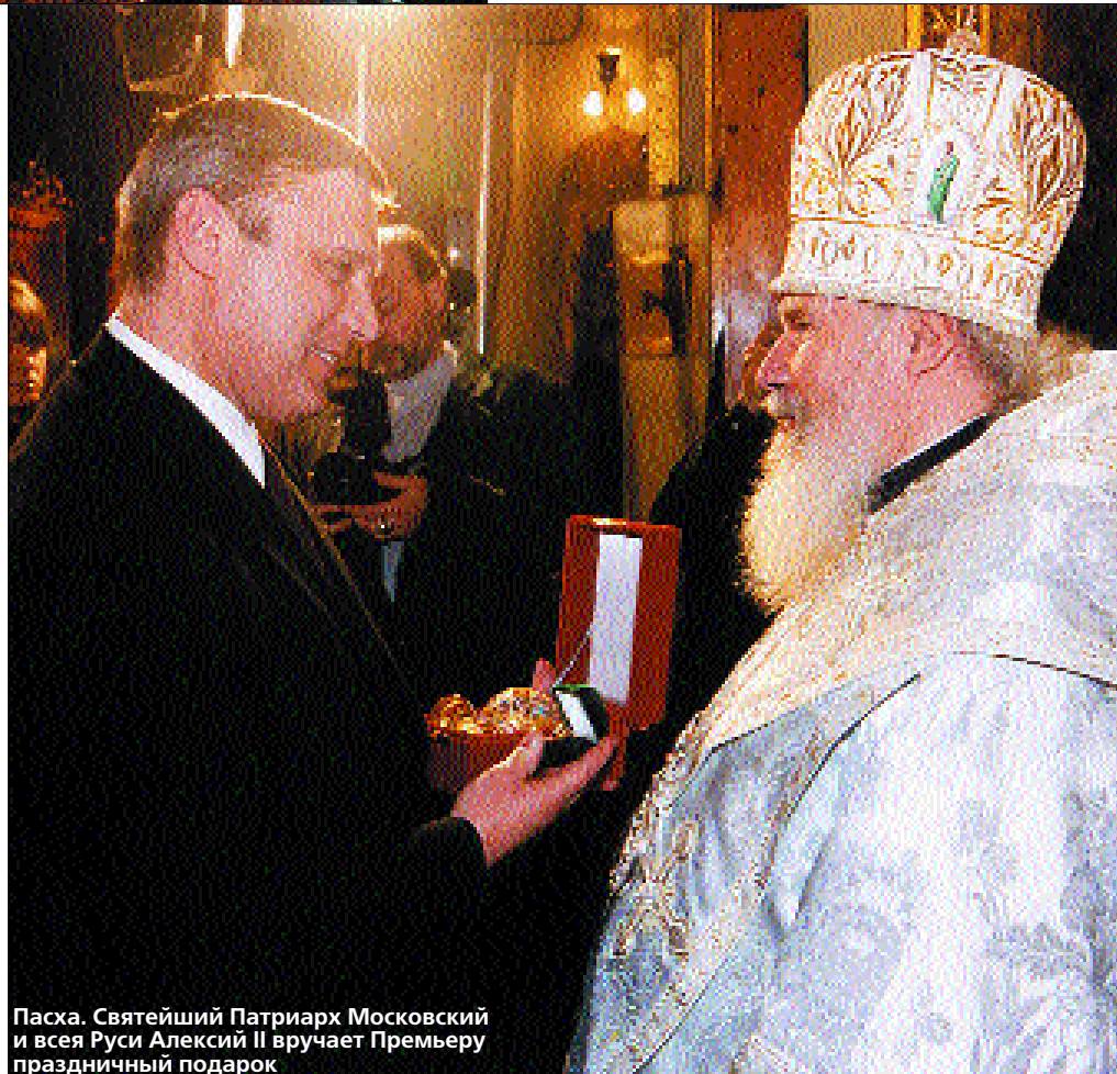
Пасха. Святейший Патриарх Московский и всея Руси Алексий II вручает Премьеру праздничный подарок

– Я это оцениваю несколько меньше, скажем, 6–6,5 процентов. Поскольку премьер должен быть несколько консервативен в оценках, поэтому я и называю такую цифру.