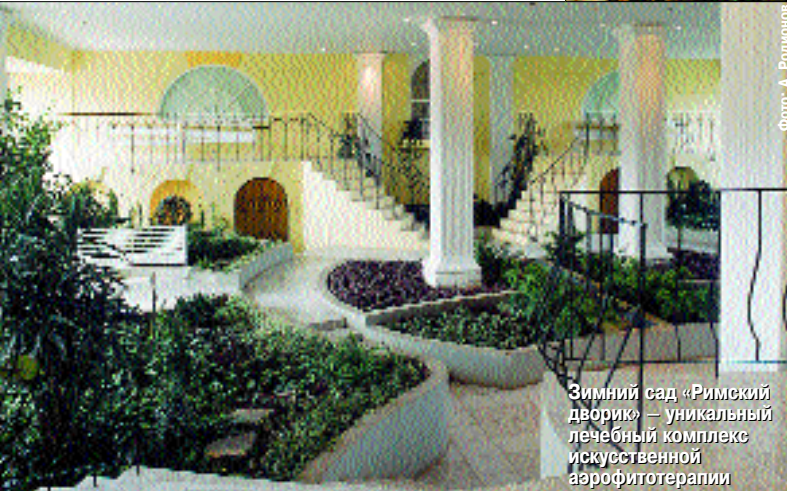
Зимний сад «Римский дворик» – уникальный лечебный комплекс искусственной аэрофитотерапии