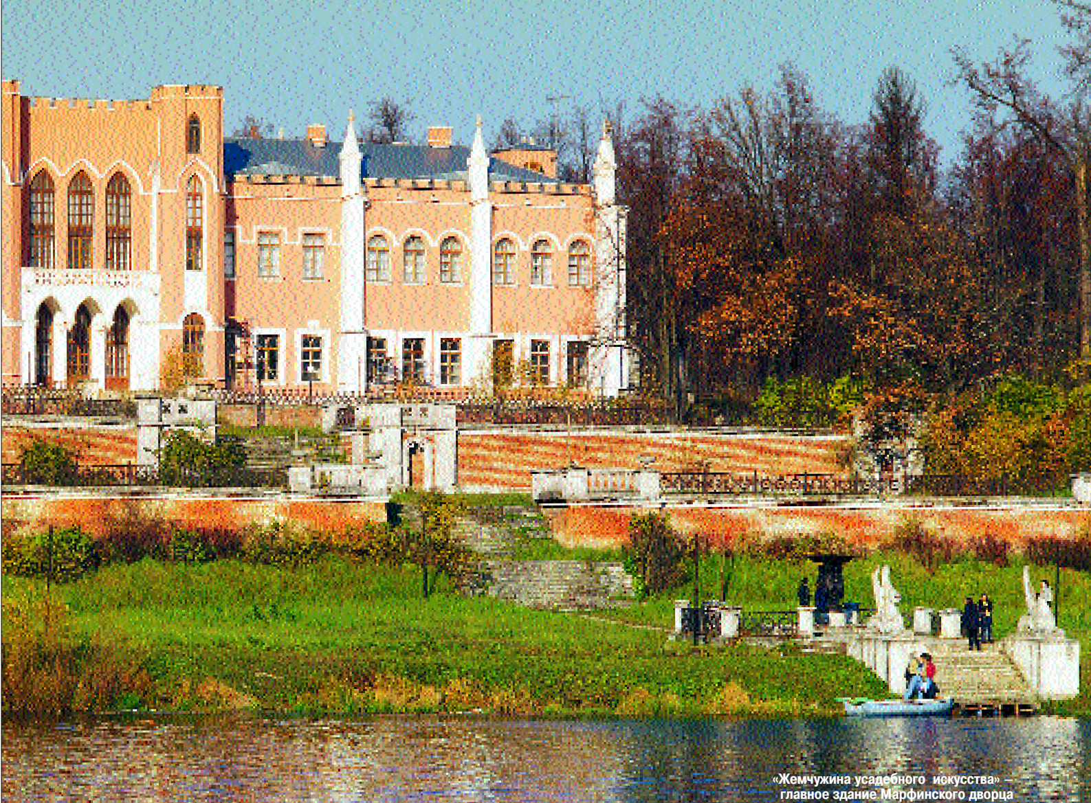
«Жемчужина усадебного искусства» — главное здание Марфинского дворца