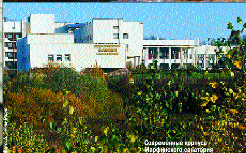
Современные корпуса Марфинского санатория

В 1999 году защитил докторскую диссертацию по вопросам восстановительного лечения, в том же году стал профессором Кафедры реабилитации и традиционных методов лечения Государственного института усовершенствования врачей МО РФ.