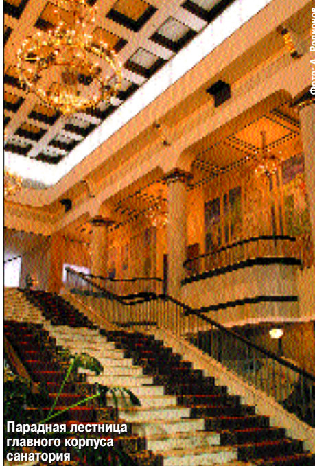
Парадная лестница главного корпуса санатория

– Безусловно! Весь процесс курортного лечения можно разделить на три этапа. Первый момент – это уточнение диагноза и обязательно определение степени адаптации и резервов. Второй этап –