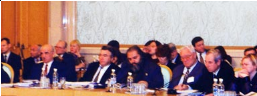
Заседание «круглого стола» по взаимодействию общественных и государственных организаций в сфере укрепления национальной безопасности, противостояния коррупции, борьбы с международным терроризмом

Форум должен был дать возможность гражданскому обществу взглянуть на себя, убедиться самим гражданским активистам, что они есть, что они влиятельны, что их нельзя игнорировать.