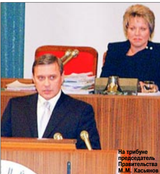
На трибуне председатель Правительства М.М. Касьянов

Итоговое пленарное заседание Форума состоялось 22 ноября 2001 года. На нем выступили председатель Правительства Российской Федерации Михаил Касьянов, заместитель председателя Правительства России Валентина Матвиенко, а также основные участники и ведущие проблемных дискуссий Форума, сообщив об основных итогах их работы.