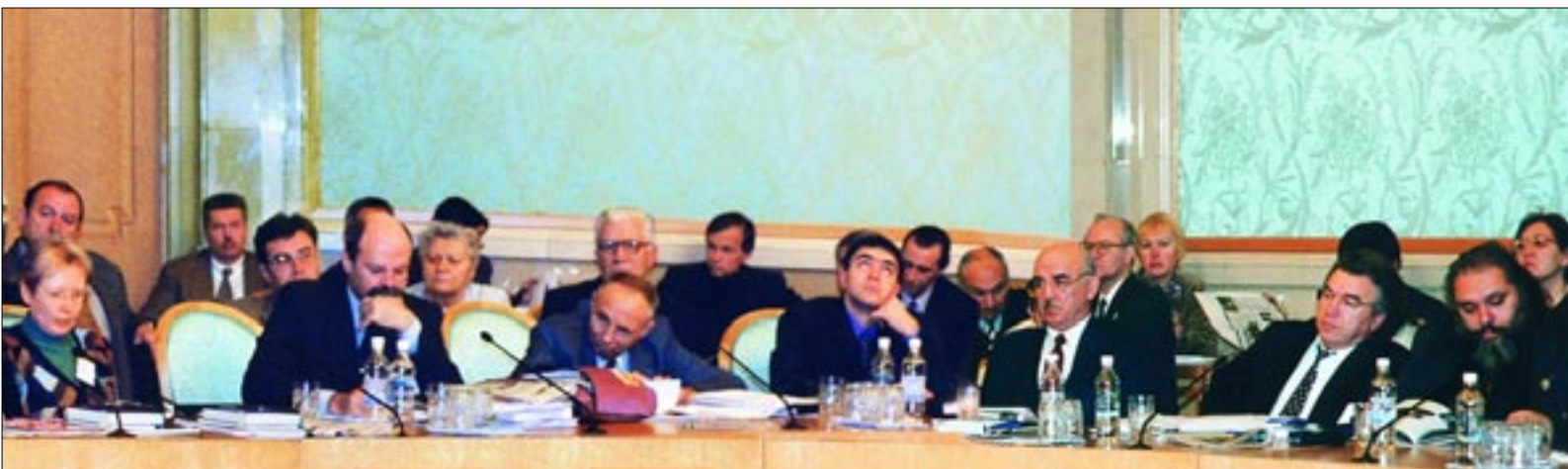
Проблемная дискуссия «Национальная, общественная и экономическая безопасность, внешняя политика. Взаимодействие гражданских и государственных институтов»