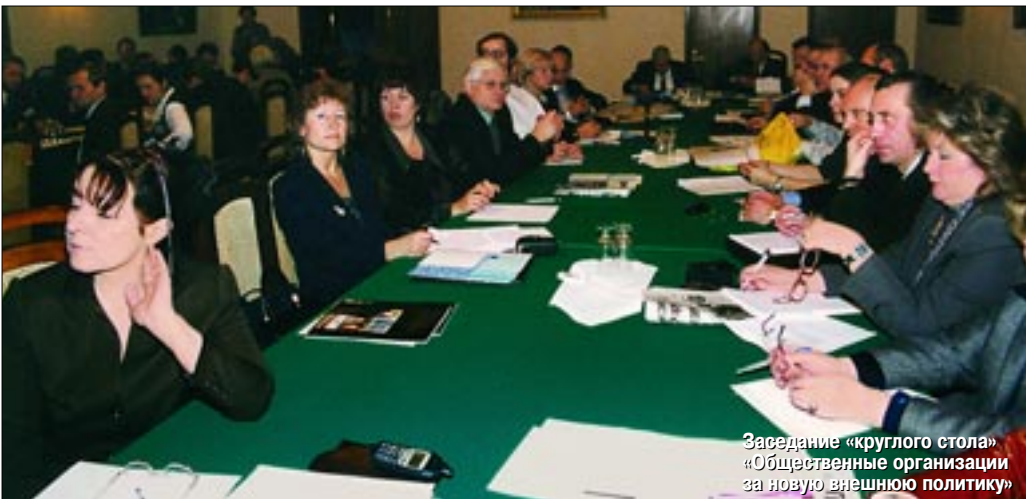
Заседание «круглого стола» «Общественные организации за новую внешнюю политику»

Но этого мало. Давайте спросим у себя, наконец, кто же некомпетентен? Некомпетентно общество или некомпетентна бюрократия? Правда, есть еще и пресса. Все видели, как зла была пресса на нас, на подготовку Форума. Причем не на кого-то в отдельности, а на всех вас, здесь присутствующих, вместе. Слишком явный упрек: а вы кто такие? Общество – это мы, комментаторы и обозреватели. А вы – пчеловоды, садоводы, эксперты и вообще ренегаты. Сегодня один журна-