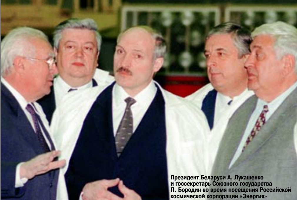
Президент Беларуси А. Лукашенко и госсекретарь Союзного государства П. Бородин во время посещения Российской космической корпорации «Энергия»

ко дням культуры России в Беларуси и Беларуси в России очень нагляден. На этих днях люди ощущают то, что они и так чувствуют – что мы действительно единый народ. Десятилетия жизни в условиях разобщенности вторичны. Духовная суть наших народов сохранена. Никакие разделы последних лет не развели людей. У человека есть понимание его мира. Раньше это было ощущение Советского Союза. Отсюда нам важно иметь это общее пространство, на котором работает эта единая культура. Есть, к сожалению, и ложка дегтя. На мой взгляд, средства массовой информации уделяют недостаточно внимания этим праздникам. Это, вероятно, специфика СМИ, что проявляется и в России, и в Беларуси. СМИ работают на политический заказ, на сиюминутную «читабельность», и забывают про культурно-идеологическое обеспечение. Это относится не только ко дням культуры. У нас большие программы в этой области. Есть совместные телепрограммы. Их около семи. Много совместных радиопередач. Фактически в неделю у нас три-четыре совместные радиопередачи. Много также совместных печатных изданий, есть совместный