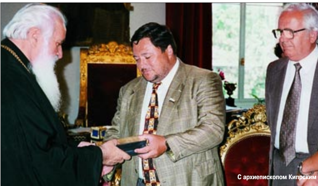
С архиепископом Кипрским

премии должен быть выше номинанта республики. Чисто количественный показатель численности населения России и Беларуси делает участие в конкурсе неравным. Понятно, что такие фигуры, как Василь Быков, не замыкаются в национальном масштабе. Этой цели можно достигнуть за счет высокопрофессиональных стандартов. Появилось огромное количество писателей новой волны. Но тот же Астафьев по своему нравственному калибру никак не хуже, например, Сорокина. Критерии нравственности или таланта могут быть и не модными на сегодняшний день.