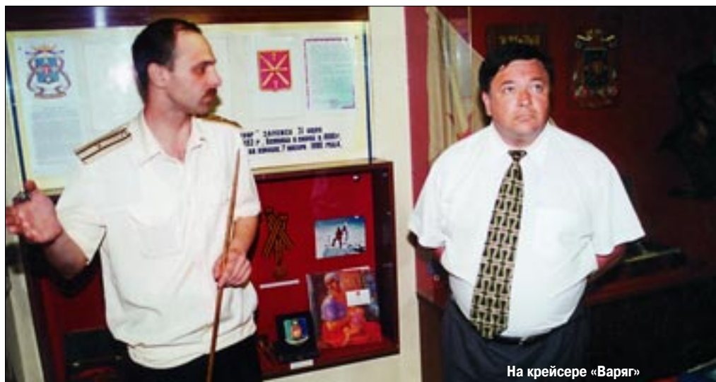
На крейсере «Варяг»

решения, все-таки больше ориентируются на вещи, связанные с формальными показателями, тогда когда важно не как назвать, а какое содержание мы вкладываем в эту суть. Нужно беспристрастно, без политической ангажированности проанализировать, что реально необходимо для того, чтобы создать более благоприятные условия для жизни как в Беларуси, так и в России. Отсюда и проблемы, связанные с совместным законодательством. Действительно, сегодня есть одно противоречие, связанное с тем, что уже необходимо унифицированное законодательство,