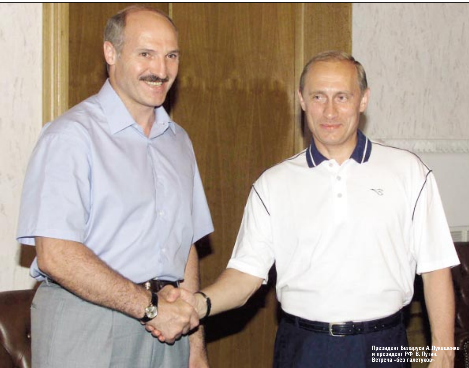
Президент Беларуси А. Лукашенко и президент РФ В. Путин. Встреча «без галстуков»