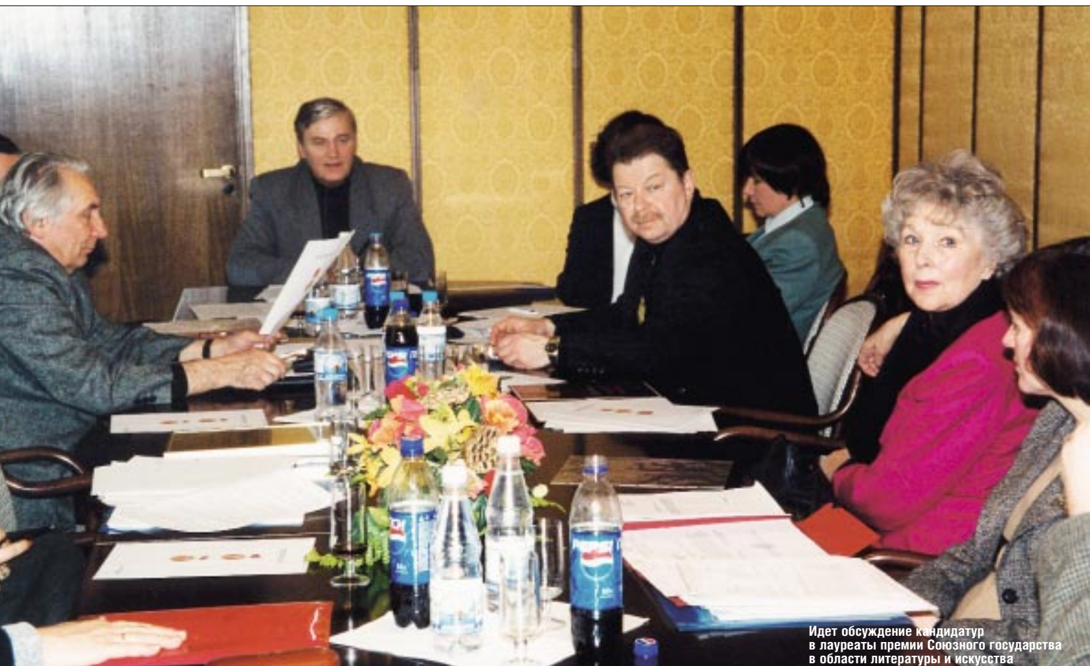
Идет обсуждение кандидатур в лауреаты премии Союзного государства в области литературы и искусства

– Учреждение премии Союзного государства в области литературы и искусства явилось первым серьезным шагом после распада Советского Союза в деле интеграции ответственности наших стран, дальнейшего объединения культурного пространства союзных государств на основе многовековых традиций. Культура – обширная сфера в жизни и деятельности людей, она очень разнообразна и включает в себя и кино, и театр, и живопись, и литературу, и балет, и эстраду. Я часто бываю на представлениях российских творческих коллективов в Беларуси и белорусских артистов в России и вижу,