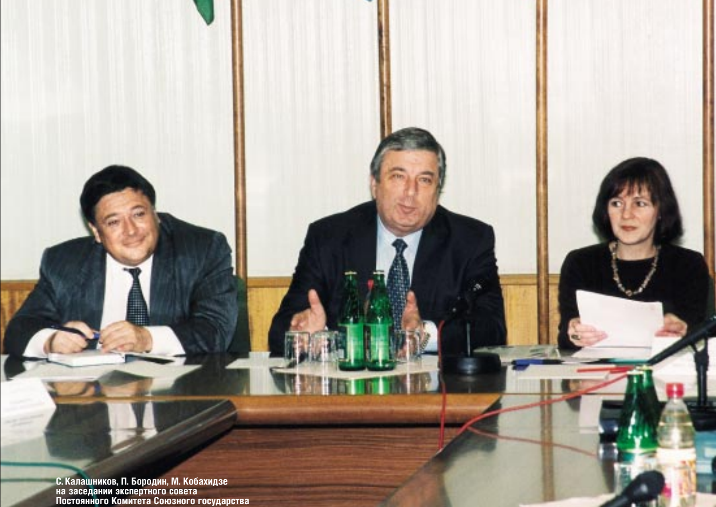
С. Калашников, П. Бородин, М. Кобахидзе на заседании экспертного совета Постоянного Комитета Союзного государства

В чем смысл присуждения премии? Награждая людей, внесших особый вклад в культуру наших стран, мы не только признаем их творческие заслуги, но участвуем в процессе взаимного культурного обогащения. Своим творчеством люди искусства помогают сближению России и Беларуси, а эта премия станет для них еще большим стимулом, поскольку взаимная поддержка и признание создают неповторимую общую культурную среду.