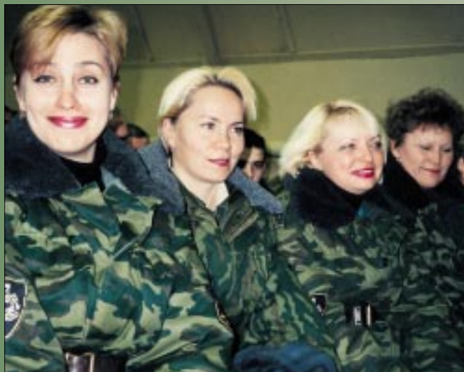
Врачи и медсестры медицинского отряда специального назначения Главного военного клинического госпиталя ВВ МВД РФ