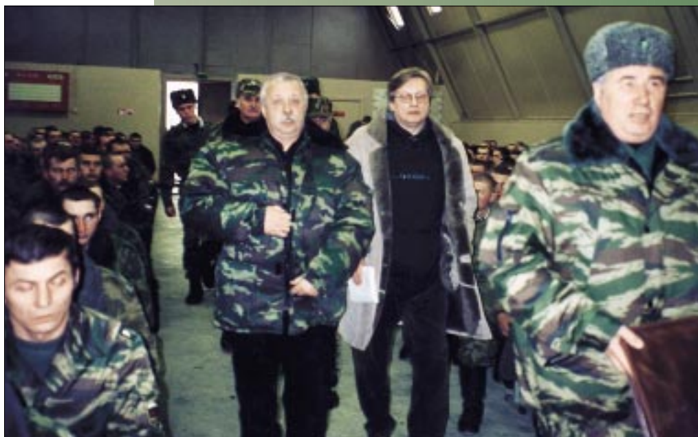
Перед началом встречи с воинами