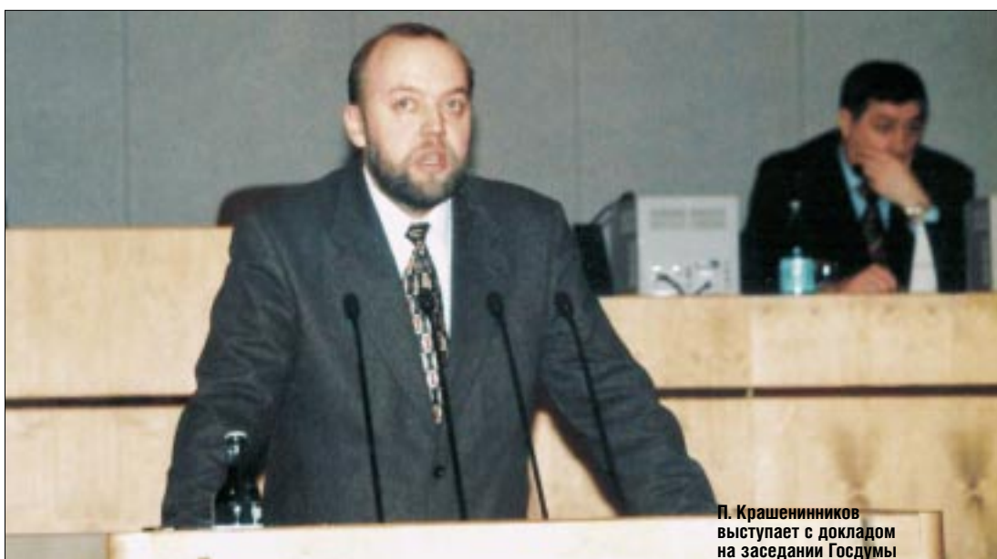
П. Крашенинников выступает с докладом на заседании Госдумы

Российская армия с каждым днем все больше и больше лишается своей боеспособности, а государство уже просто не в состоянии нести расходы на подобные Вооруженные силы. Поэтому у нас просто нет другого выхода, кроме как вводить другие условия комплектования и содержания войск; рано или поздно это произойдет, вопрос лишь во времени, и я считаю, что лучше это время не упускать, а то потом будет многократно сложнее и болезненнее проводить какие-либо преобразования. Совершенно очевидно, что при реализации предлагаемой нами концепции решается целый ряд хронических проблем: например, не надо будет постоянно переобучать вновь приходящих солдат, будет лучше сохраняться материальная часть, хотя бы потому, что к ней будут просто бережней относиться, и даже чисто денежные затраты в конечном счете окажутся меньше, чем на обучение и содержание срочников.