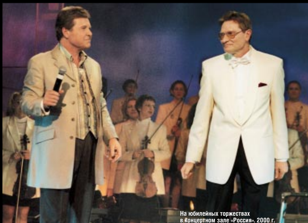
На юбилейных торжествах в концертном зале «Россия». 2000 г.

– Я понимаю только одно, что в общественном устройстве эффективно действуют не люди, а некие системы, которые должны каким-то образом возникнуть, как-то сложиться. Часто один человек не в состоянии что-то изменить даже на каком-то узком участке. И, конечно, должно пройти очень много времени, прежде чем изменятся имеющиеся ныне ментальные стереотипы. И если говорить о влиянии на этот процесс государства или какой-то крупной общественной организации, то прежде всего оно должно выражаться в поддержке фундаментальных областей человеческой интеллектуальной деятельности. Я имею в виду культуру, науку. А также и религию. Эта область