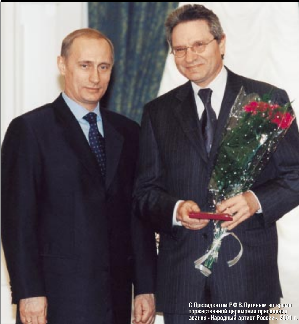
С Президентом РФ В. Путиным во время торжественной церемонии присвоения звания «Народный артист России», 2001 г.

– В основном ораториально-хоровую. Я сейчас написал большое сочинение, которое в конце мая будет исполняться на празднике славянской письменности в Новосибирске. Это оратория, абсолютно академическое произведение. Хор, оркестр, солисты. Называется «Легенда о Ермаке». Тексты подобраны из разных источников.