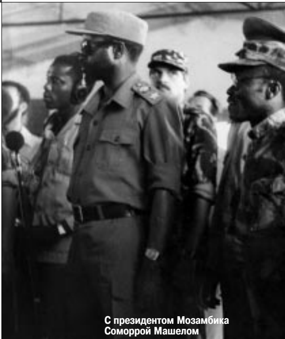
С президентом Мозамбика Соморрой Машелом

Как бы то ни было, страхование никогда не пользовалось особой популярностью в Советском Союзе. В лучшем случае к нему прибегали как к способу накопления: бабушка застраховывала своего только что родившегося внука не за тем, чтобы (тьфу-тьфу!) в «случае чего» получить деньги на похороны, а с единственной целью – подарить повзрослевшему чадушке накопленную путем многолетних взносов сумму.