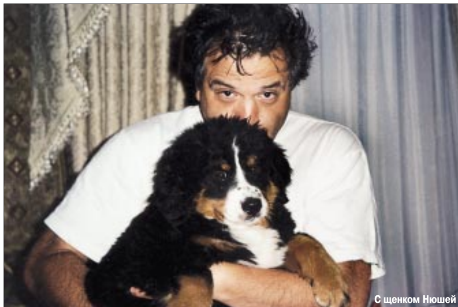
С щенком Ньюшей

при невнимательном отношении страховой компании, по мнению недобросовестных партнеров, можно. И если нельзя трижды удалить аппендицит одному и тому же больному, то какие-то дорогостоящие процедуры можно осуществлять сколько угодно, не забывая вписывать их в счета для страховой компании. Так же, как лечить больных очень дорогими лекарствами. Вопрос лишь в одном: как проверить, имели