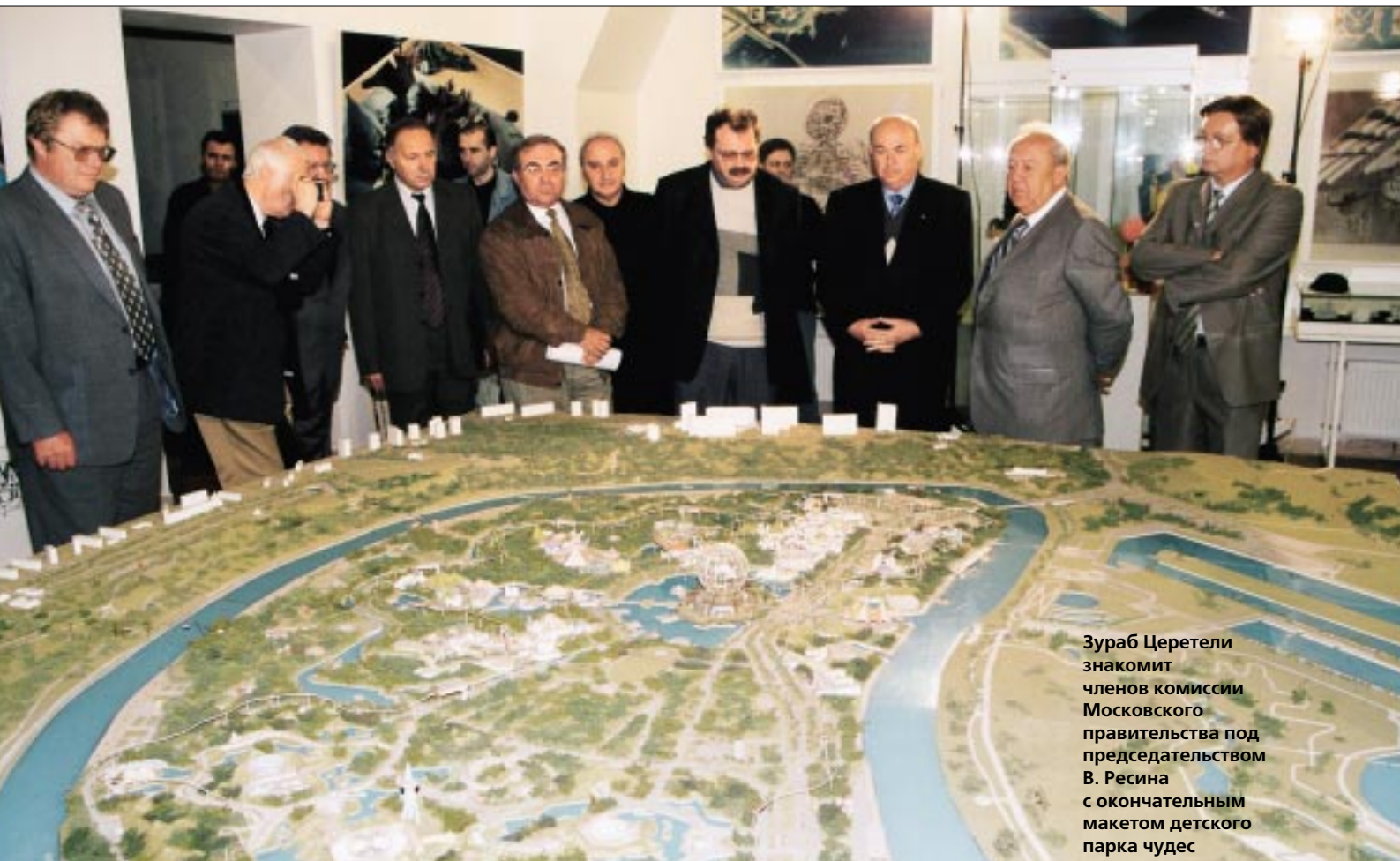
Зураб Церетели знакомит членов комиссии Московского правительства под председательством В. Ресина с окончательным макетом детского парка чудес

– 19 июня этого года за огромные заслуги перед мировой культурой, а также за создание выдающихся скульптурных композиций и монументальных произведений Вы были единогласно избраны членом-корреспондентом Академии Изящных искусств (Академии Бессмертных) Франции, основанной еще в 1648 году кардиналом Ришелье. Что для Вас значит эта