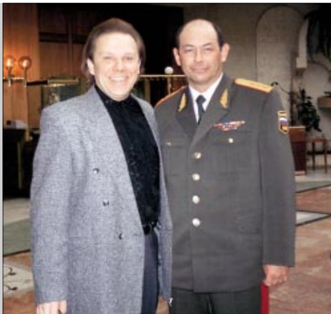
На сцене – народный артист России