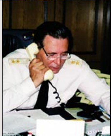
В рабочем кабинете Государственной думы.

голова. И тут меня, как в народе говорят, ударил настоящий «кондратий». Вижу руку потерпевшего на гриве зверя. Кричу ему: «Убери руку!» Тот команду выполнил и, как потом сам рассказывал, потерял сознание.