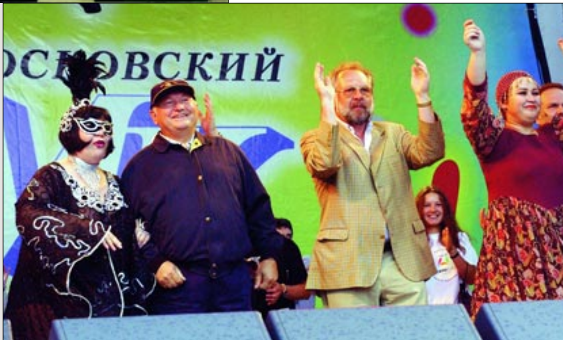
С Ю.М. Лужковым на празднике "МК" в Лужниках

— Как Вы считаете, в деле убийства Холодова существует полная ясность? На скамье подсудимых все виновные в этом преступлении?