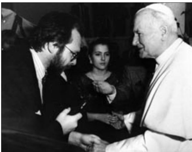
Аудиенция у Папы Римского Иоанна Павла II

— Прежде всего, нужно сказать, что «МК» на сегодняшний день — это, действительно, большой издательский дом, который включает в себя 91 газету и различные журналы. Сюда входят и газеты, которые выходят в регионах: это абсолютно самостоятельные издания со своими редакциями, со своим творческим коллективом, со своими бюджетами и со своим, если так можно выразиться, внутренним финансированием. Где-то процентов 60 материалов мы присылаем из Москвы, а 40 собирают на местах сами журналисты; и получаются, в об-