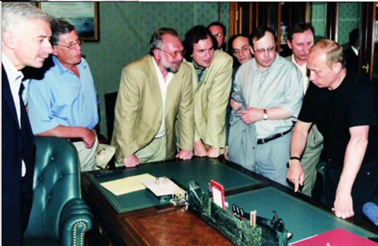
В резиденции Президента РФ В.В. Путина «Бочаров ручей» в Сочи

Как мы всего этого достигли? В начале 90-х годов прошлого века мы пошли по пути консолидации всего капитала. Абсолютно законным путем все акции были переданы в единые руки — главному редактору и генеральному директору в одном лице, то бишь мне; в результате чего появился один собственник. Поэтому стало очень трудно располить, раздвоить или как-то еще негативно повлиять, — а именно с этим сталкиваются другие издания, — на весь наш издательский дом. Иными словами мы юридически себя обезопасили. В дальнейшем встал вопрос о финансовой безопасности. Для этого был подобран, на мой взгляд, очень сильный менеджмент, перед которым поставили задачу: не работать по-черному, а работать по-белому, но, вместе с тем, найти в рамках нашего российского законодательства наиболее выгодные, перспективные, дающие наибольший эффект в работе финансово-экономические схемы. Это было тоже осуществлено. И в связи с тем, что нам не нужно собирать акционерных собраний, не нужно долго думать, сколько процентов и каких средств перебросить в то или иное место — все у нас решается очень быстро и динамично, путем консультаций с различными специалистами. А в результате получается, что мы очень быстро реагируем на потребности рынка, читательской аудитории, и это приносит свои плоды. Поэтому у нас большинство изданий работает без дефицита, с прибылью.