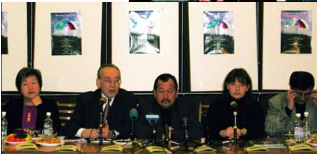
Беседа В.Рузина с режиссером Герцем Франком