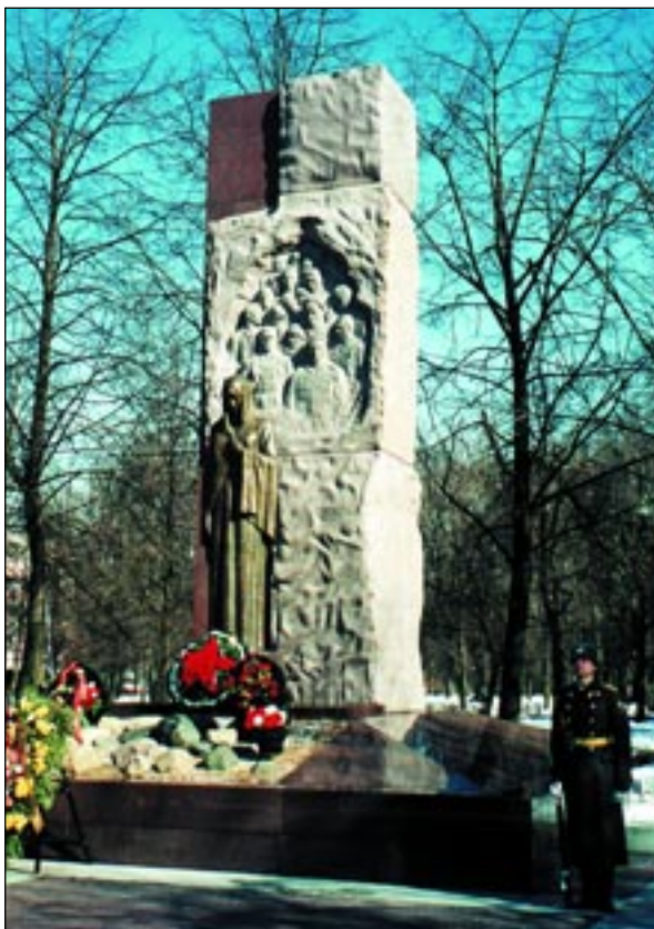
Монумент «Воинам внутренних войск» на Красноказарменной улице