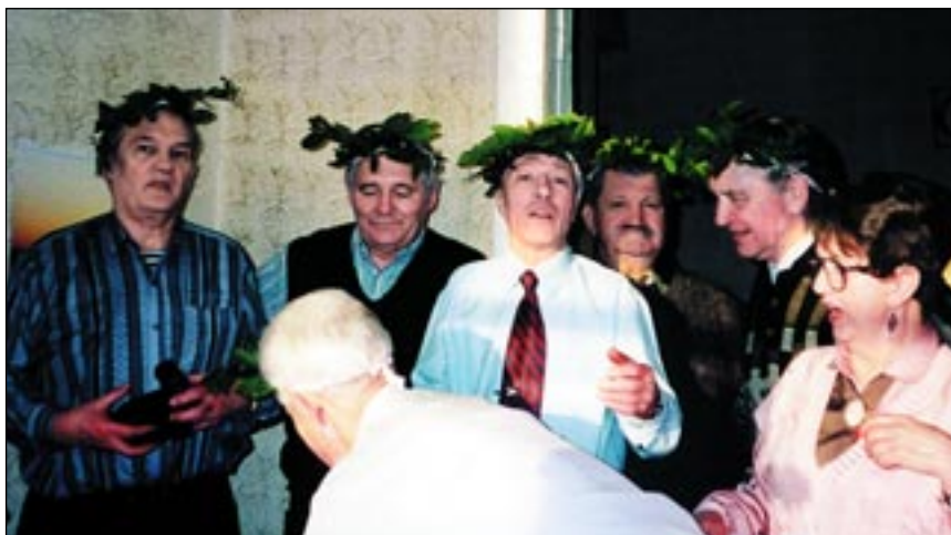
Встреча с одноклассниками через 50 лет