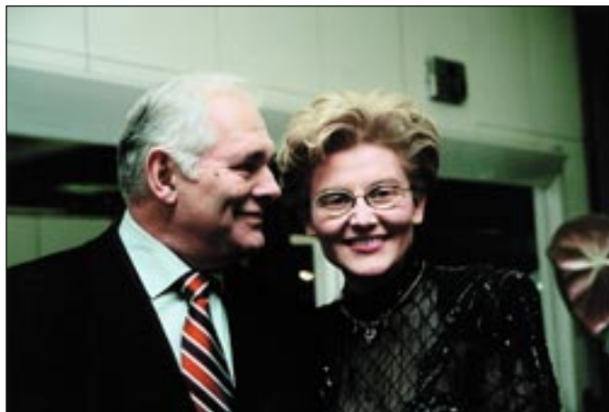
Доктор Рошал с Еленой Малышевой на телепередаче «Здоровье»