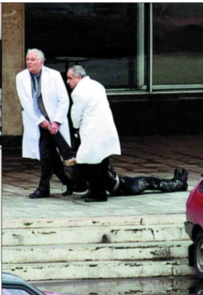
2002 год... Трагедия на Дубровке