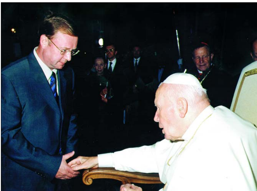
Официальный визит в Ватикан. С.В.Степашина принимает глава римско-католической церкви папа Иоанн Павел II

Сейчас элита во власти занята практическим строительством новой российской государственности. Мно-