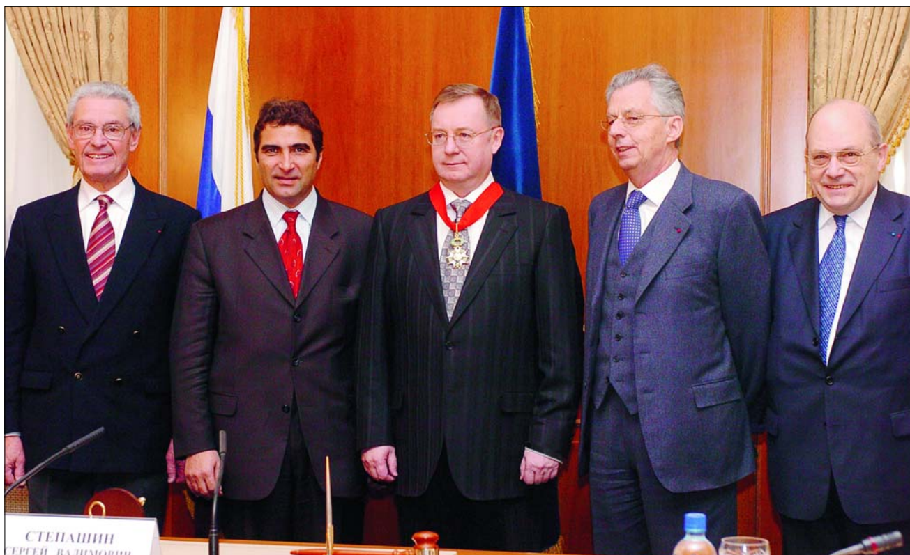
Высокая международная оценка заслуг С.В. Степашина. Посол Французской республики в РФ от имени руководства страны вручил ему высшую награду Франции – орден Почетного Легиона

В результате в России еще нет самой главной основы, кирпичика гражданского общества – гражданина, активного субъекта общественных отношений, который бы не противопоставлял себя обществу только потому, что в нем его что-то не устраивает, а в меру своих возможностей предпринимал шаги, направленные на его улучшение. Для того чтобы подобный базис сформировался, необходимо активнее привлекать население в различные общественные организации, которые не только объединяют граждан, но и про-