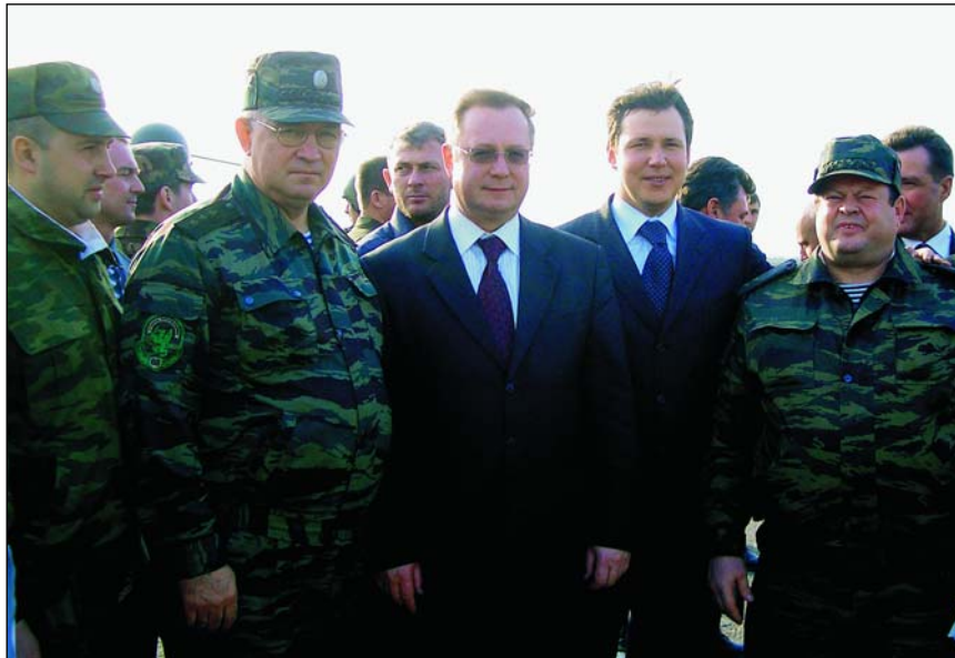
Очередная встреча С.В. Степашина с руководством Чеченской Республики и Регионального оперативного штаба на Северном Кавказе

– Законодательные инициативы Президента по назначению губернаторов и принятие Думой соответствующих законов вызвали неоднозначную реакцию в обществе. Вам как председателю Счетной па-