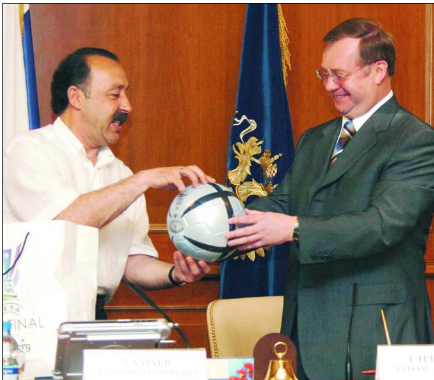
«Этот мяч трижды влетел в ворота «Спортинга». Главный тренер ЦСКА Валерий Газзаев вручает серебряный «Ротейру» Председателю попечительского совета «Динамо» и заядлому футбольному болельщику Сергею Степашину

рода». Тем не менее в обществе сильны настроения против выдвинутой идеи. Вот еще один случай, когда элита могла бы выполнить свою просветительскую функцию, сгладить противоречие между властью и обществом по затронутому вопросу и тем самым способствовать укреплению собственного государства, приверженного демократическим ценностям.