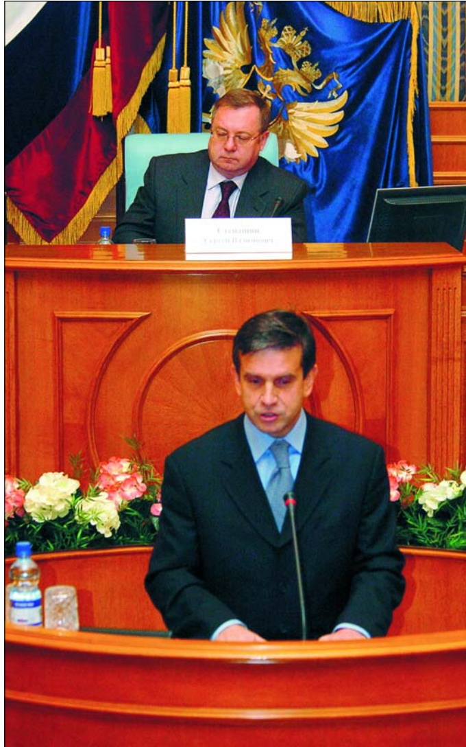
Отчитывается министр здравоохранения и социального развития РФ М. Зурабов

– В предыдущих беседах с Вами мы неизменно возвращались к вопросу о том, насколько актуальна применительно к нашей современности оценка ситуации, которая емко и лаконично выражена в знаменитом ответе Карамзина на вопрос о том, как дела в России: «Воруют...»?