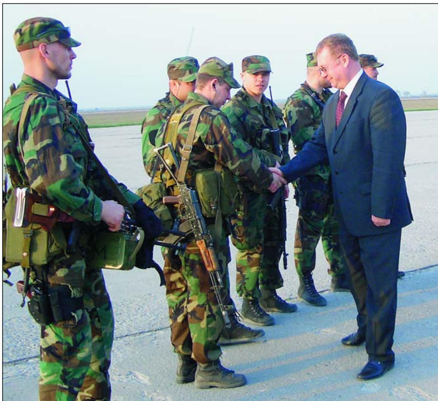
Сопредседателя Попечительского Совета Национального гражданского комитета по взаимодействию с силовыми ведомствами, правоохранительными, законодательными и судебными органами, председателя Счетной палаты РФ приветствуют воины спецподразделения в Чечне

ций («Газпром», РАО «ЕЭС» и т.п.) или с избранными населением губернаторами и мэрами и главами крупнейших частных концернов?