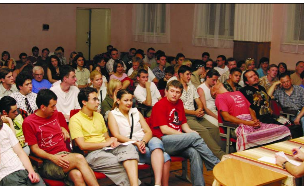
В работе форума приняло участие около 150 молодых специалистов и экспертов