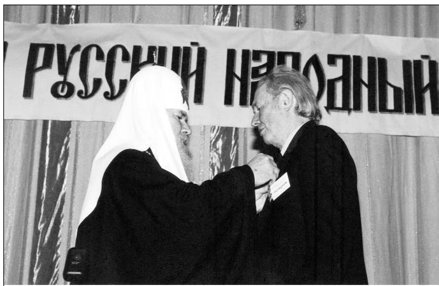
Святейший Патриарх Московский и всея Руси Алексий II вручает В. Ганичеву орден Сергия Радонежского