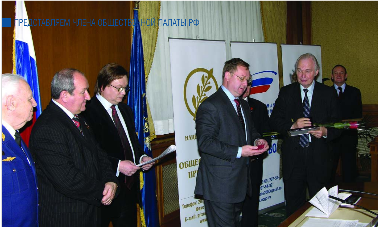
Награждение юбилейным гражданским орденом Серебряная Звезда «Общественное признание»