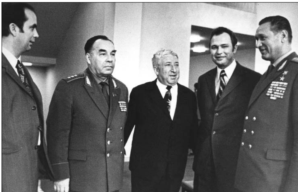
Встреча с Расулом Гамзатовым

– Вы ушли из «Комсомольской правды» в 1980 году. Почему?