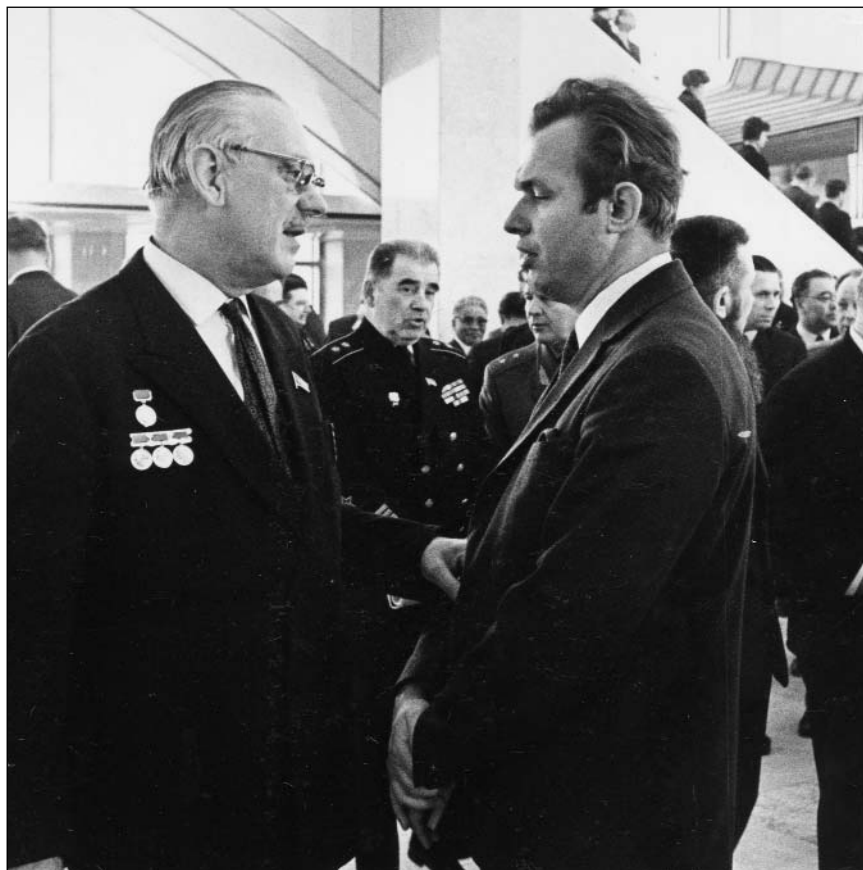
С Сергеем Михалковым

– Безусловно, нужны! Но каждая общественная организация должна не только служить тому делу, во имя которого она создана, но и помогать поддер-