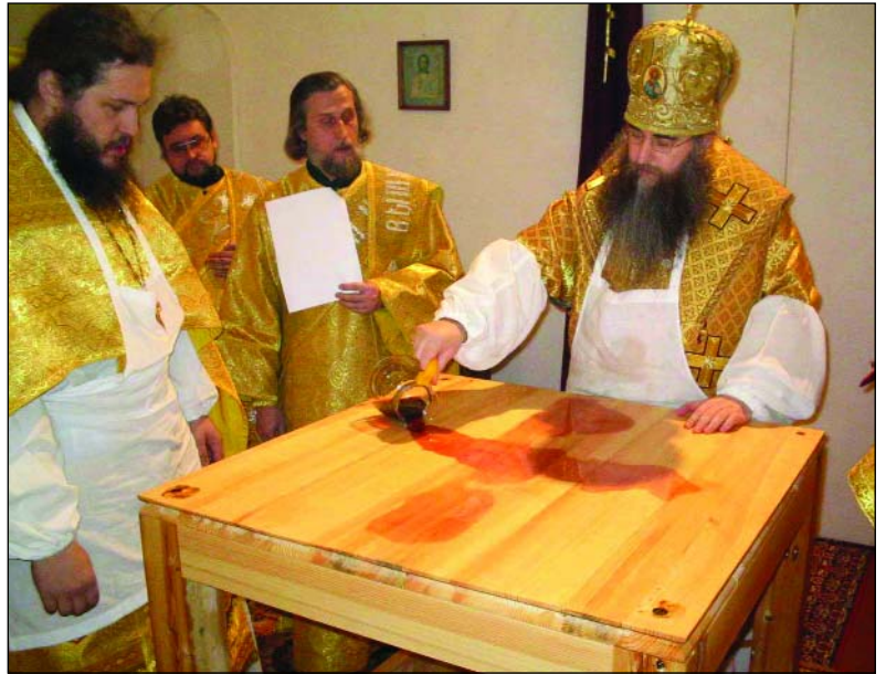
Освящение престола нового храма. Саратовская область, 2005 г.

– Всемирный Русский Народный Собор – это собрание людей разных политических и религиозных убеждений, представляющих различные уровни и ветви власти, общественные организации. И главная задача Собора одна – напомнить обществу,