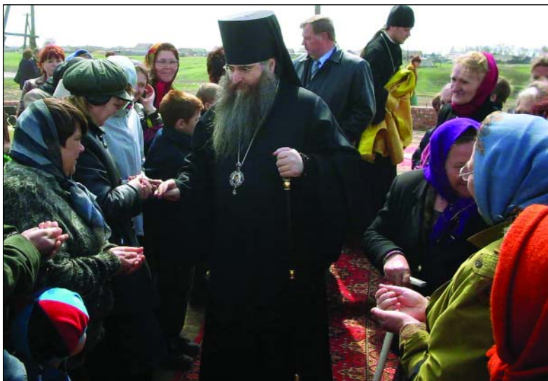
За благословением к Владыке. Саратовская область, 2005 г.