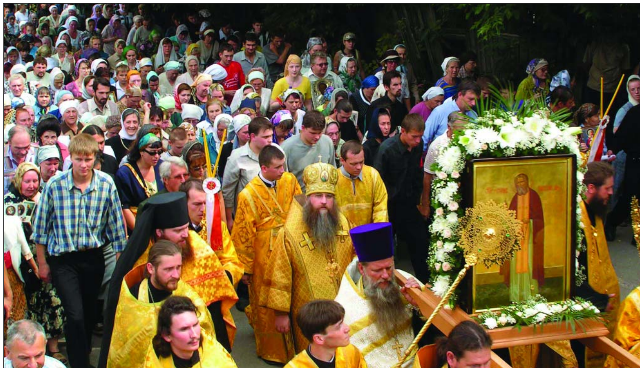
Крестный ход с иконой преподобного Серафима Саровского. Саратов, 2004 г.

вать с ночным клубом, который несколько лет занимал это помещение и, конечно, не спешил его освобождать. В городе Вольске приступили к реконструкции красивейшего Троицкого собора, взорванного в 30-е годы. XX века. Началось возрождение Нижне-Воскресенского Иргизского монастыря у села Криволучье Балаковского района. В течение многих десятилетий в монастырских постройках размещалась психиатрическая клиника, сохранились лишь несколько зданий в очень запущенном состоянии. И в первую очередь братией была обустроена церковь во имя апостола Иоанна Богослова.