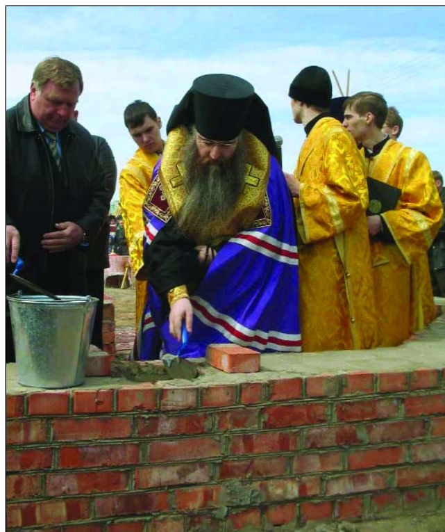
Чин основания нового храма совершает епископ Саратовский и Вольский Лонгин. Село Мироновка Саратовской области, 2005 г.

– В последнее время появляется много новых или новому экранизированных художественных произведений, которые затрагивают исторические и современные религиозные темы. Понятно, что кино, и особенно телевидение, оказывают определенное воздействие на большую аудиторию, особенно на молодежь. Как Вы считаете, приносит ли пользу появление на экранах таких фильмов, как «Мастер и Маргарита» или «Страсти Христовы», соотносится ли это с духовно-нравственными ценностями, которые нужны современному обществу?