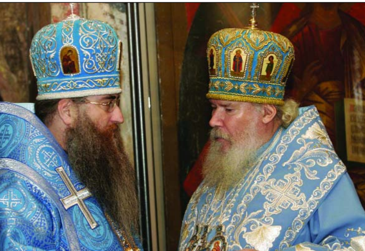
Святейший Патриарх Московский и всея Руси Алексий II и епископ Саратовский и Вольский Лонгин после богослужения в храме Христа Спасителя. Москва, 2006 г.

тому, что, приходя в мир, христианство приносило с собой принципы социальной ответственности, доказывало обществу необходимость заботиться об «униженных и оскорбленных», вдовах и сиротах, о людях, которые не нашли себе места в социуме или выпали из него по тем или иным обстоятельствам.