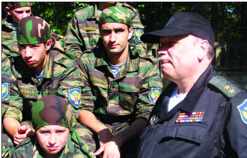
С молодыми защитниками Отечества в детском лагере «Юный спецназовец»