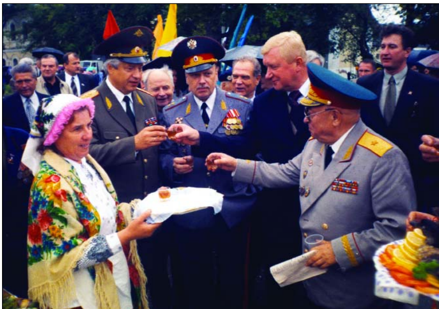
На праздновании 60-летия освобождения г. Ельни от немецко-фашистских захватчиков

повышенному риску, то есть она желает испытать на себе любые экстремальные ситуации. Очень часто молодые люди считают, что у них хватит силы воли для того, чтобы «слезть» с иглы. Но, как правило, этого не происходит, потому что многие наркотики напрямую влияют на генетические изменения организма: на работу печени, почек, сердца и т.д. И поэтому попытка «соскочить» оборачивается тем, что люди начинают еще больше употреблять наркотики для того, чтобы облегчить свои страдания, которые вызваны этими необратимыми изменениями.