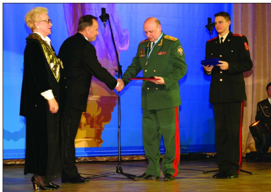
Вручение премии «Меценаты России»

Современная молодежная культура не имеет границ, и зачастую именно под ее влиянием формируется интерес к наркотикам, и они приходят в молодежную среду. Но вопрос заключается даже не в том, сколько наркотиков пришло в тот или иной регион, а насколько эффективно власть борется с их распространением или выстраивает систему противодействия их популяризации. Местные власти должны выстроить свою систему таким образом, чтобы сама социально-экономическая структура не позволяла либо препятствовала употреблению наркотиков. К этому можно отнести создание досуговых учреждений, прием-