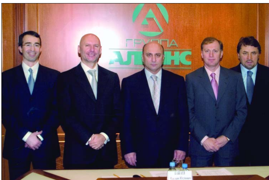
С партнерами и соратниками по бизнесу

– К сожалению, сегодня в обществе формируется очень много негативных образов: это и чеченцы, и «лица кавказской национальности», и иностранцы вообще. Вы посмотрите, что творится в Воронеже, в Питере! Но еще более удручает, что подобные процессы характерны не только для России, но и для многих стран мира. Драматические события во Франции в 2005 году, невероятно ожесточенная реакция на публикацию карикатур на пророка Мухаммеда в исламском мире, разгул терроризма – все это, на мой взгляд, свидетельствует о широком распространении в мире чувства взаимной нетерпимости, неприязни, вражды по отношению ко всему «чужому». То есть это проблема общемировая, общечеловеческая, а не только российская.