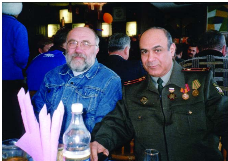
Во время прохождения военных сборов и учебы в Академии Генерального штаба ВС РФ

– Да. И мой опыт работы в Думе поможет, я надеюсь, в работе в Общественной палате. Я уже говорил, что меня выдвинула организация «Юристы за