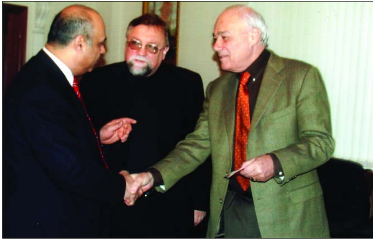
Слева направо: Президент ГРА Г. Мирзоев и президент Федеральной палаты адвокатов РФ Е. Семеняко вручают известному телеобозревателю В. Познеру нагрудный знак «Почетный адвокат России»

права и достойную жизнь человека», и из 42 членов Палаты 38 меня поддержали своими голосами.