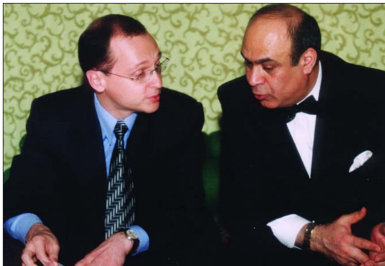
С Сергеем Владиленовичем Кириенко

комитетов. Она осуществляет общественный контроль за деятельностью правительства страны. Это необходимо делать! В любой демократической стране граждане должны знать, на что идут их налоги.