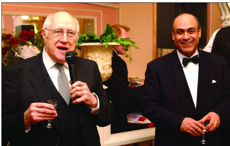
С Мстиславом Ростроповичем

– Она может проводить не только экспертизу законов, но и проверку нормативных правовых актов министерств,