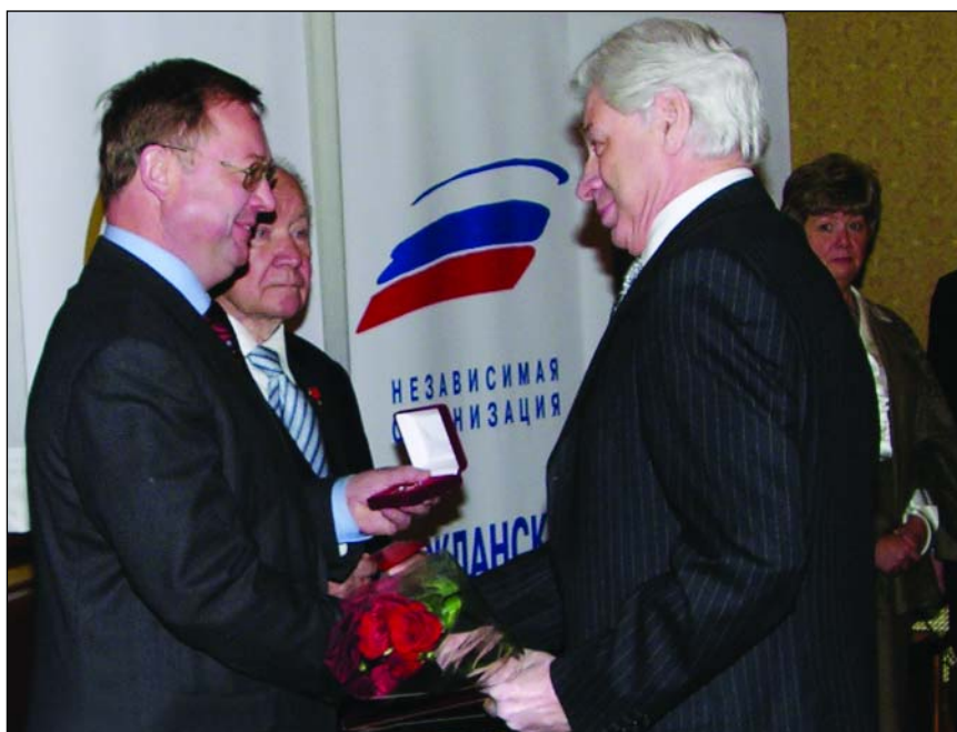
Во время награждения юбилейным гражданским орденом Серебряная звезда «Общественное признание»

– Времена меняются, но юристы, практикуя, применяют те законы, которые в стране имеются. И если у них есть хотя бы две извилины, они понимают, что в каком законе написано. Кроме того, каноны права не изменились за несколько последних столетий. Например, была теория права, был предмет «государство и право», «уголовное право». Принцип уголовного права сохра-