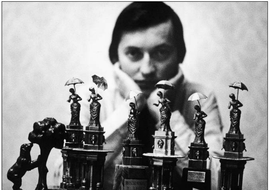
Среди своих «Оскаров», 1981 г.

Потребовалось вмешательство президента страны. «Если есть хоть ничтожная доля опасности загрязнения Байка-