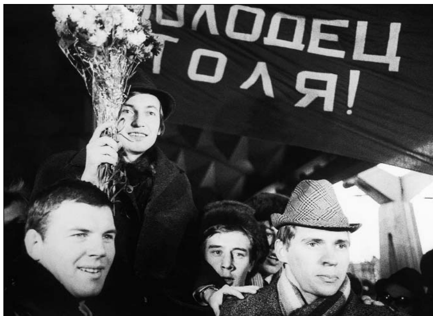
Чемпион на руках у болельщиков, 1978 г.

ную значимость этой идеи, но потом мне удалось убедить, рассказав о жизни и быте шахматистов России. Ведь у нас до сих пор практически везде остались шахматные клубы. Они действуют, хотя на них набрасываются, потому что в старые времена шахматные клубы были уважаемы и занимали неплохие помещения. Удавалось и удается отбиваться, но главное, что в клубах идет активная жизнь, что очень важно при развале системы отслеживания освободившихся осужденных и оказания им какой-то моральной и организационной помощи. Раньше при выходе из мест лишения свободы бывшие заключенные регистрировались в отделениях милиции, и им обязаны были предоставить хотя бы временную работу, сейчас, к сожалению, ничего этого нет, и, выходя на свободу, очень многие намеренно совершают повторные преступления, чтобы снова попасть в тюрьму. И никому нет до этого дела, хотя заботиться должны все, потому что обеспечение заключенных идет за счет бюджета и наших налогов. Зачем бюджет лишний раз нагружать, лучше этих людей приобщить к трудовой деятельности. Так вот я веду к тому, что, научившись играть в шахматы, бывший заключенный через клуб, через знакомства временную работу всегда найдет. В шахматах никто не спрашивает твою визитную карточку. Через шахматы можно приобщать людей к нормальной жизни. и если хотя бы 100 человек мы сможем привести в нормальное состояние – это уже большая победа.