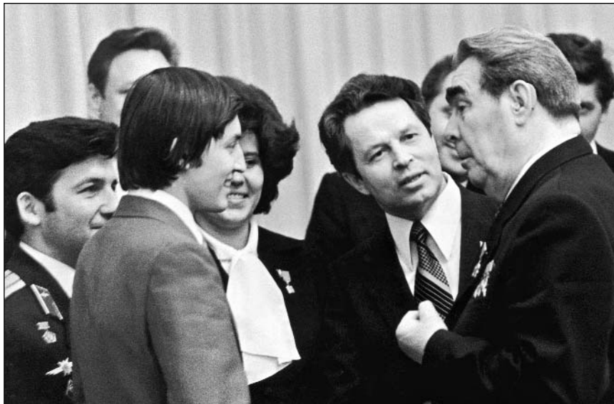
Делегация молодежи на встрече с Л.И. Брежневым, 1975 г.

Сам же я насколько могу пытаюсь влиять на ситуацию и считаю, что шахматы как раз делают кругозор шире, учат общаться, работать с книгой. Умение работать с компьютером, конечно, замечательно, но главная задача научить работать с книгой, потому что мы