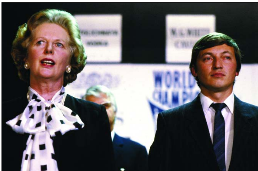
Железные люди. С премьер-министром Великобритании Маргарет Тэтчер, 1986 г.

разучились искать нужную книгу, находить в ней материал. Может быть я несколько старомоден, но считаю, что, во-первых, когда человек берет информацию с экрана, то она совершенно иначе укладывается в голове, кроме того, у человека нет времени проанализировать ее, во-вторых, это вредно для зрения, нельзя брать всю информацию с экрана. О сельских школах и маленьких городах мы пока не говорим, но через несколько лет и они придут к полной компьютеризации. Более того, мы пошли вслед за Европой, разрешая работать в школах с калькуляторами, а это безобразие. Школа должна научить в том числе и считать а когда ты все умеешь, тогда и пользуйся калькулятором в целях экономии времени.