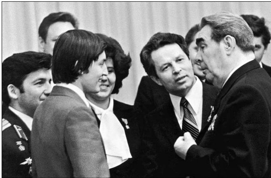
Делегация молодежи на встрече с Л.И. Брежневым, 1975 г.

Сам же я насколько могу пытаюсь влиять на ситуацию и считаю, что шахматы как раз делают кругозор шире, учат общаться, работать с книгой. Умение работать с компьютером, конечно, замечательно, но главная задача научить работать с книгой, потому что мы