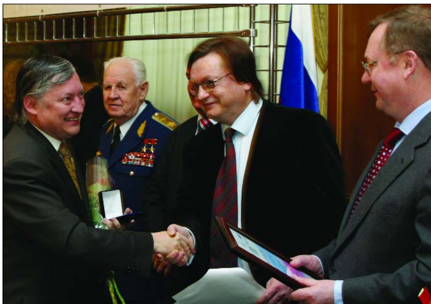
Во время награждения юбилейным гражданским орденом Серебряная звезда «Общественное признание»

Занимаемся не только бытом, но и духовным миром. Находясь в попечительском совете, я предложил свою программу, программу шахматную. Поначалу не все поняли и оценили обществен-