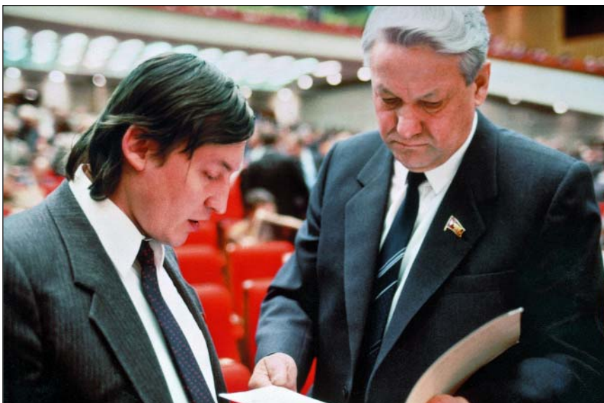
На съезде народных депутатов СССР с Б.Н. Ельциным, 1989 г.

В свое время наша страна была самой читающей, сейчас на первом месте Китай, на втором – Индия. И почему мы должны брать пример с Америки, которая вообще не читает, а не с Китая, который читает в колоссальных объемах, чему я сам свидетель. Я совсем недавно был в столице южно-китайской провинции, по китайским понятиям город небольшой – 4 миллиона, по мировым стандартам – приличный. Так вот они отстроили новый огромный Дом книги размером, превосходящим московский Детский мир. Наш самый большой Дом книги на Арбате не идет ни в какое сравнение, да и он сейчас наполовину не книжный.