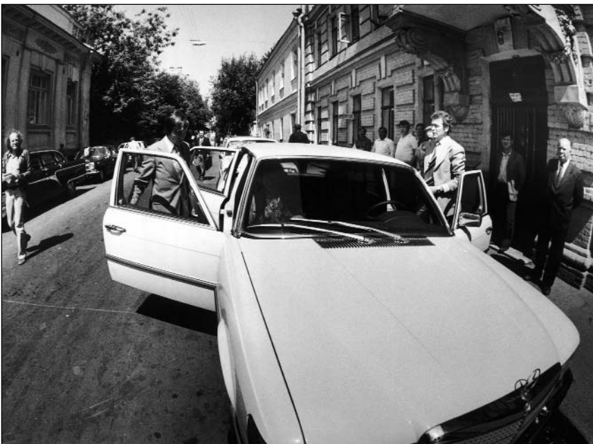
«На таких «Мерседесах» ездят Брежнев, Высоцкий и я», 1977 г.

– Шахматы связаны с выступлениями и общением и позволяют без знания языка общаться с людьми из разных стран. Так повелось, и не мной это заведено, что шахматисты всегда выступали до и после турниров. Моя деятельность по линии общественной дружбы началась, когда я только стал чемпионом мира. Я провел большую программу выступлений во Франции в 1975 году и один из немногих, кто награжден золотой медалью города Парижа за развитие шахмат и получил эту медаль из рук нынешнего президента Франции, а тогда мэра Парижа Жака Ширака. Провел несколько недель в Италии по линии дружбы СССР – Италия и т.д. Благодаря