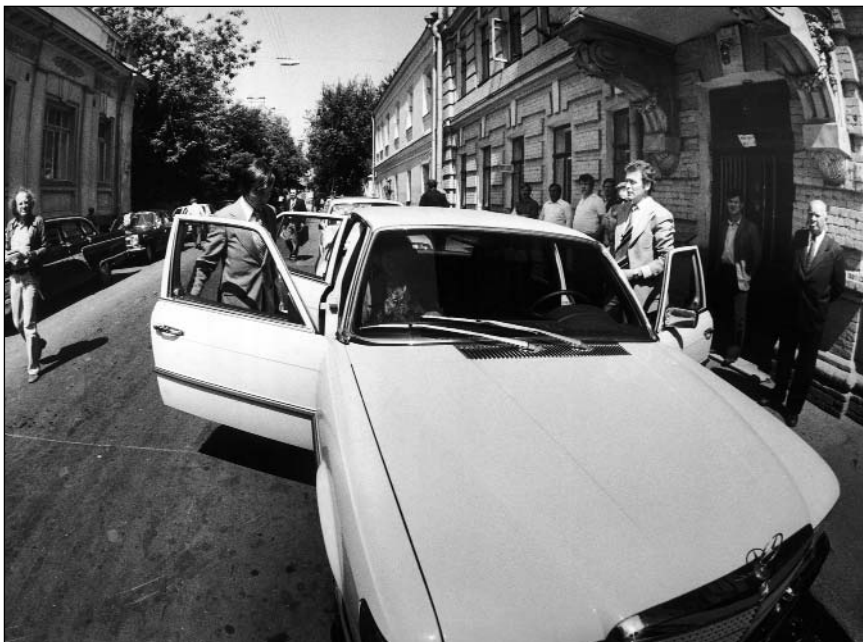
«На таких «Мерседесах» ездят Брежнев, Высоцкий и я», 1977 г.

– Шахматы связаны с выступлениями и общением и позволяют без знания языка общаться с людьми из разных стран. Так повелось, и не мной это заведено, что шахматисты всегда выступали до и после турниров. Моя деятельность по линии общественной дружбы началась, когда я только стал чемпионом мира. Я провел большую программу выступлений во Франции в 1975 году и один из немногих, кто награжден золотой медалью города Парижа за развитие шахмат и получил эту медаль из рук нынешнего президента Франции, а тогда мэра Парижа Жака Ширака. Провел несколько недель в Италии по линии дружбы СССР – Италия и т.д. Благодаря