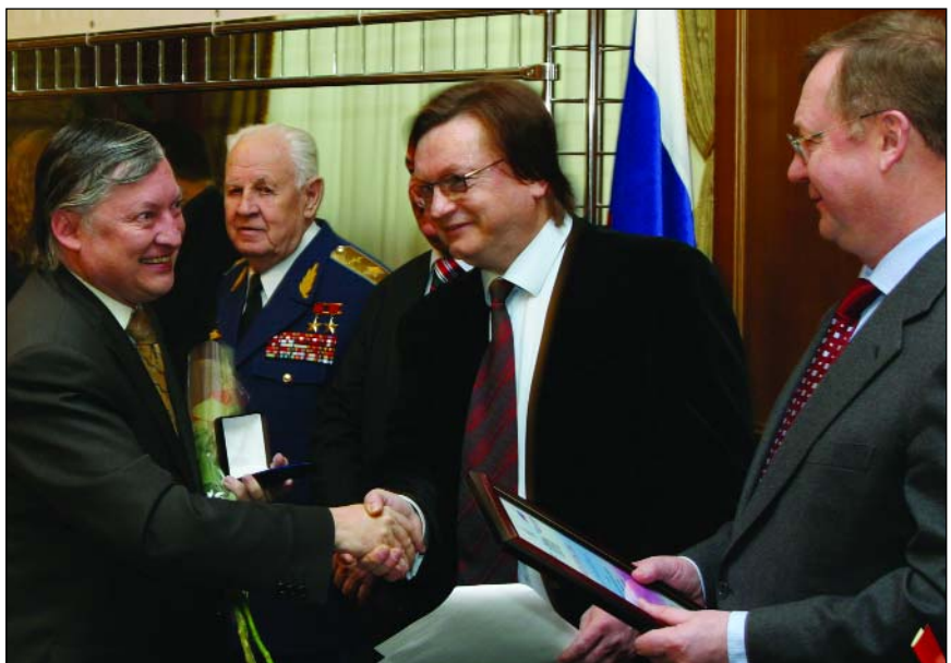
Во время награждения юбилейным гражданским орденом Серебряная звезда «Общественное признание»

Занимаемся не только бытом, но и духовным миром. Находясь в попечительском совете, я предложил свою программу, программу шахматную. Поначалу не все поняли и оценили обществен-