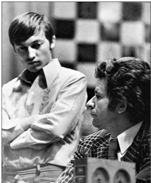
Полуфинальный матч претендентов Спасский – Карпов. Ленинград, 1974 г.