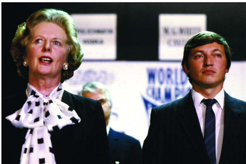
Железные люди. С премьер-министром Великобритании Маргарет Тэтчер, 1986 г.

разучились искать нужную книгу, находить в ней материал. Может быть я несколько старомоден, но считаю, что, во-первых, когда человек берет информацию с экрана, то она совершенно иначе укладывается в голове, кроме того, у человека нет времени проанализировать ее, во-вторых, это вредно для зрения, нельзя брать всю информацию с экрана. О сельских школах и маленьких городах мы пока не говорим, но через несколько лет и они придут к полной компьютеризации. Более того, мы пошли вслед за Европой, разрешая работать в школах с калькуляторами, а это безобразие. Школа должна научить в том числе и считать а когда ты все умеешь, тогда и пользуйся калькулятором в целях экономии времени.