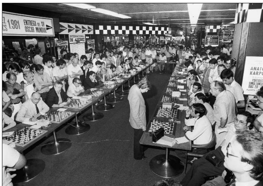
«Лошадью ходи, лошадью!» Сеанс одновременной игры в Барселоне, 1981 г.