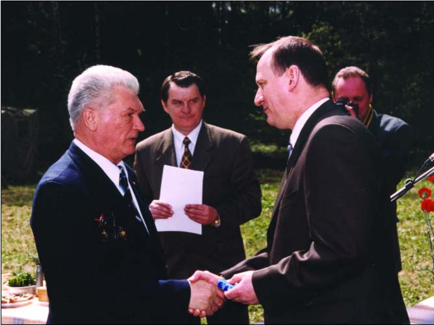
Н. П. Патрушев поздравляет с 55-летием Победы. 2000 год

ли депутаты Верховного Совета России, избранные народом. Находились там и простые люди, которые пришли их поддержать. А если бы мы ввязались в боевые действия, как от нас требовали, море крови было бы пролито.