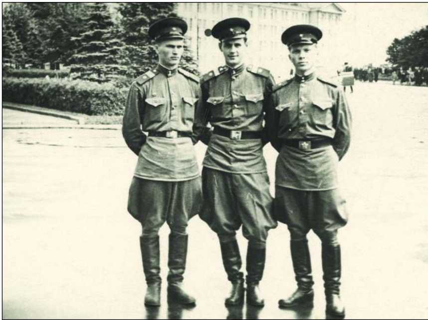
Служба в Кремлевском полку. Однополчане. 1955 год

– Значит, можно сказать, что «Альфа» – это подразделение настоящих мужчин.