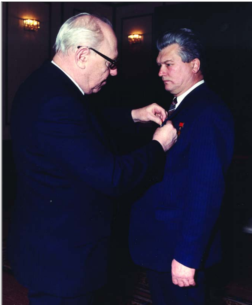
Вручение Золотой Звезды Героя Советского Союза и ордена Ленина. 19 декабря 1986 года. Награду вручает В. М. Чебриков

Если говорить об октябре 1993 года, то рано утром, в 4 часа 30 минут, к Ельцину были вызваны руководители «Альфы» и «Вымпела». Задачу нам ставил он. И я тогда сразу решил для себя: если мы будем выполнять беспрекословно требование Ельцина, в глаза людям я потом смотреть не смогу. Ведь в Белом доме были не бандиты, не захватчики. Там бы-