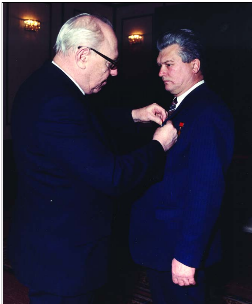
Вручение Золотой Звезды Героя Советского Союза и ордена Ленина. 19 декабря 1986 года. Награду вручает В. М. Чебриков

Если говорить об октябре 1993 года, то рано утром, в 4 часа 30 минут, к Ельцину были вызваны руководители «Альфы» и «Вымпела». Задачу нам ставил он. И я тогда сразу решил для себя: если мы будем выполнять беспрекословно требование Ельцина, в глаза людям я потом смотреть не смогу. Ведь в Белом доме были не бандиты, не захватчики. Там бы-