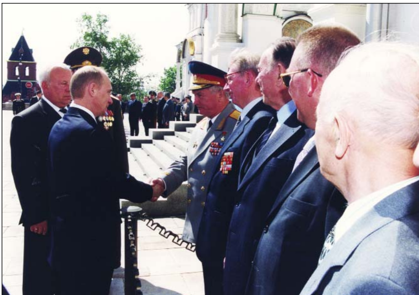
Празднование 65-летия Президентского полка. Президент В. В. Путин здоровается с ветеранами полка. 2001 год

ны и проведены другие оперативные мероприятия, в результате чего заложники были освобождены.