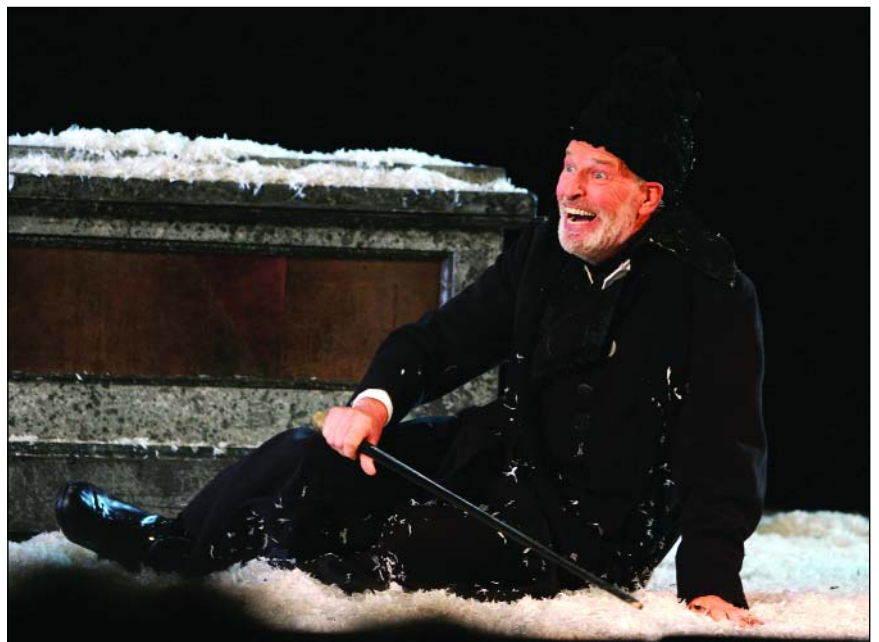
Лермонтовский «Маскарад» в снежном Петербурге