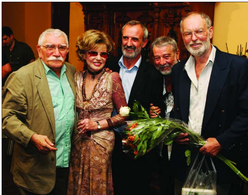
«А друзей у меня действительно много»