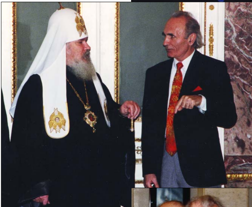
С Патриархом Московским и всея Руси Алексием II

– Да, действительно, у нас было общество «Знание», куда люди шли с удовольствием. Почему его закрыли? Чиновники посчитали, что достаточно того, что есть телевидение, радио, журналы и газеты. Хотя какие знания можно получить, скажем, по телевидению, если там показывают одни убийства, а по-