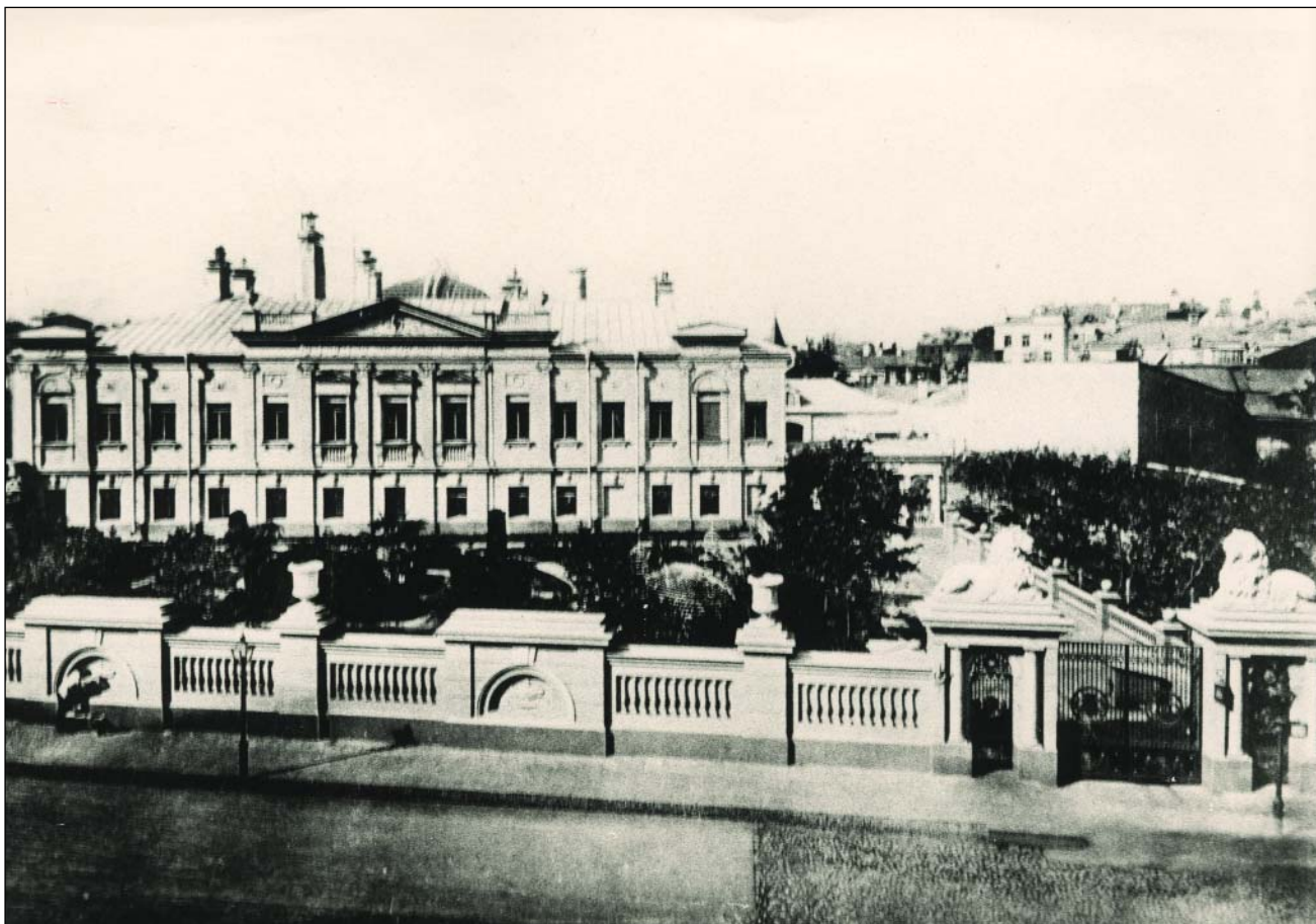
Фасад Дома с улицы Пречистинки 1910 год