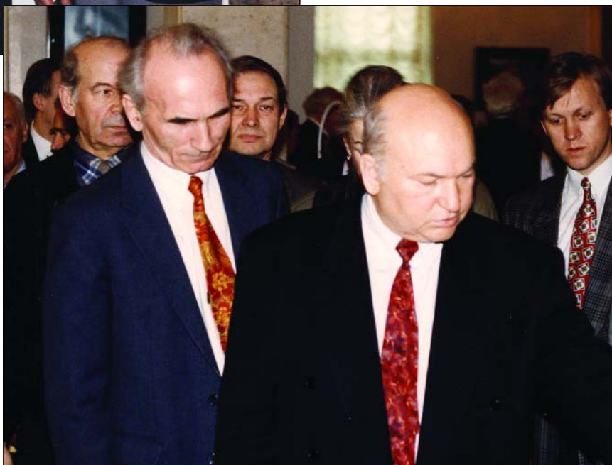
В.С. Шкарковский с мэром Москвы Ю.М. Лужковым

– Учитывая, что в последнее время практически свернута деятельность таких просветительных организаций, как, например, общество «Знание», на Дом ученых, вероятно, ложится дополнительная нагрузка. Что бы вы могли рассказать нашим читателям об очень