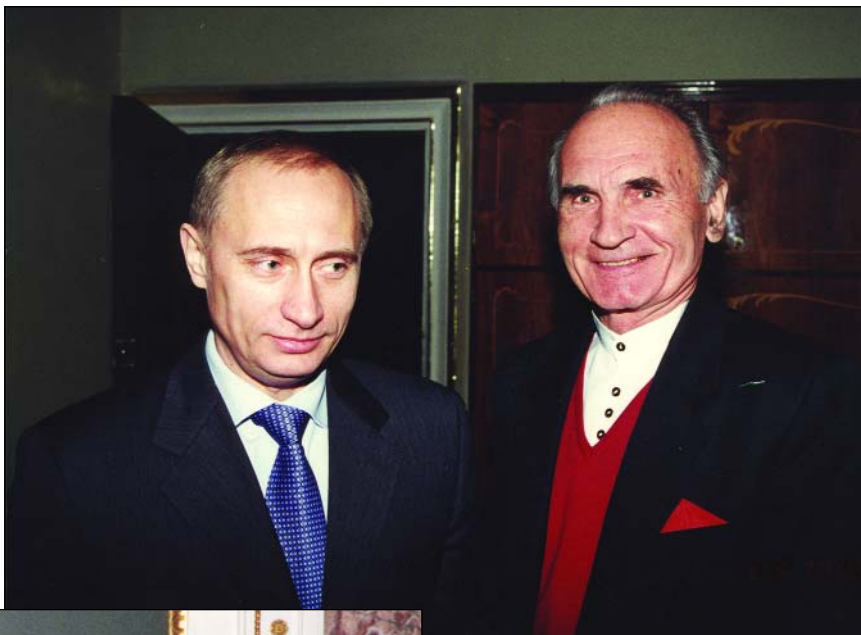
Президент России В.В. Путин и В.С. Шкарковский

Конечно, Дом ученых не может сам полностью окупать свое содержание – коммуналку, ремонт, зарплату сотрудников. Поэтому, если для самоокупаемости мы поставим высокие цены, то это станет не по карману нашим членам. Бытует мнение, что науку надо содержать на бюджете, а все относящееся к