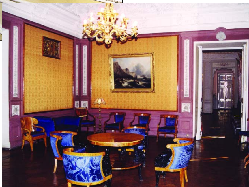
Фрагмент восстановленного интерьера

В нашем доме постоянно работают кружки и студии художественной самодеятельности, и работают хорошо. Есть свой драматический театр и эстрадный театр «Дуэт». Все они состоят из ученых, которые сами пишут сценарии, сами играют роли. У нас есть замечатель-