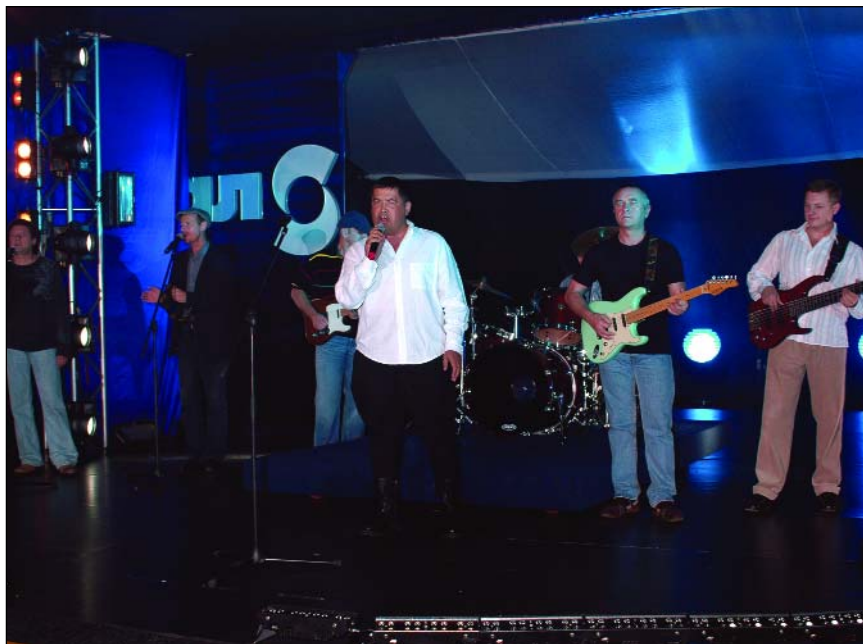
Поздравление от группы «ЛЮБЭ»

лиза состояния дел в самых разных сферах; на базе стратегии идет разработка программ, и появляется перспектива. Поэтому тренд, которого мы стараемся придерживаться в своих отношениях с муниципалитетами и региональными властями – от выживания – к развитию, через программы совместной деятельности.