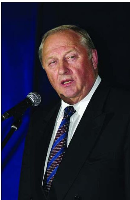
... от Э.Э. Росселя

щей работу по психосоциальной реабилитации жертв террористического акта в г. Беслане.