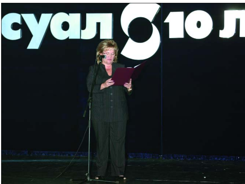
Приветственное слово от Л.К. Слиски

С 2003 года компания наиболее активно инвестирует средства в такие программы, как «Здоровье», «Спорт»,