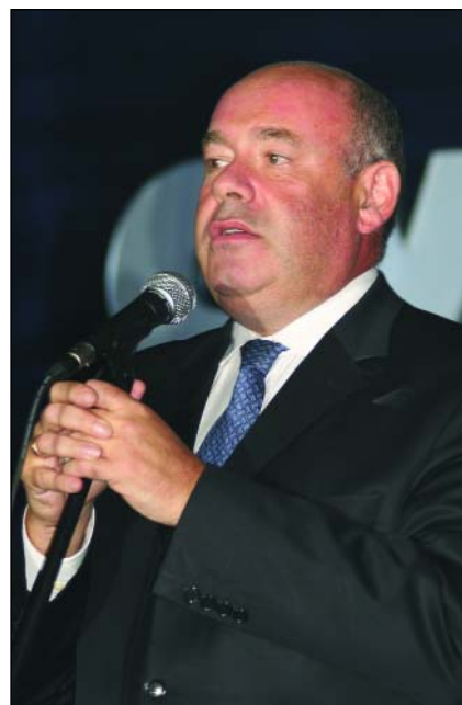
... от М.Е. Швыдкого...

● Благотворительная помощь региональной общественной организации Союз «Женщины Дона», осуществляю-