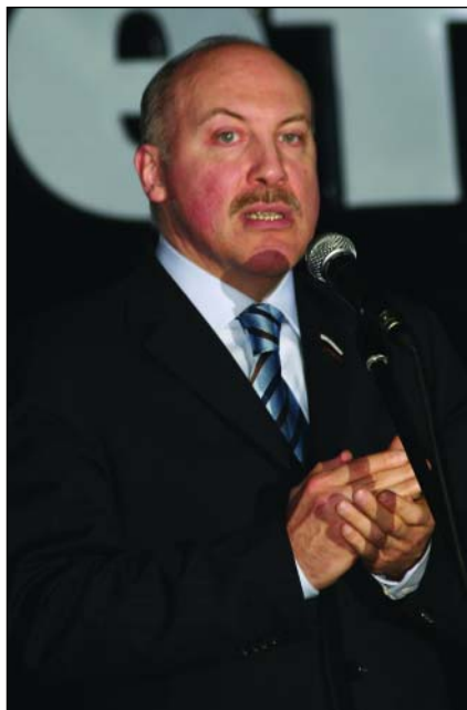
... от Д.Ф. Мезенцева...

«Культура», «Молодежь», «Забота», которые охватывают широкий круг социальных вопросов, актуальных для работы и жизни сотрудников предприятий и их семей.